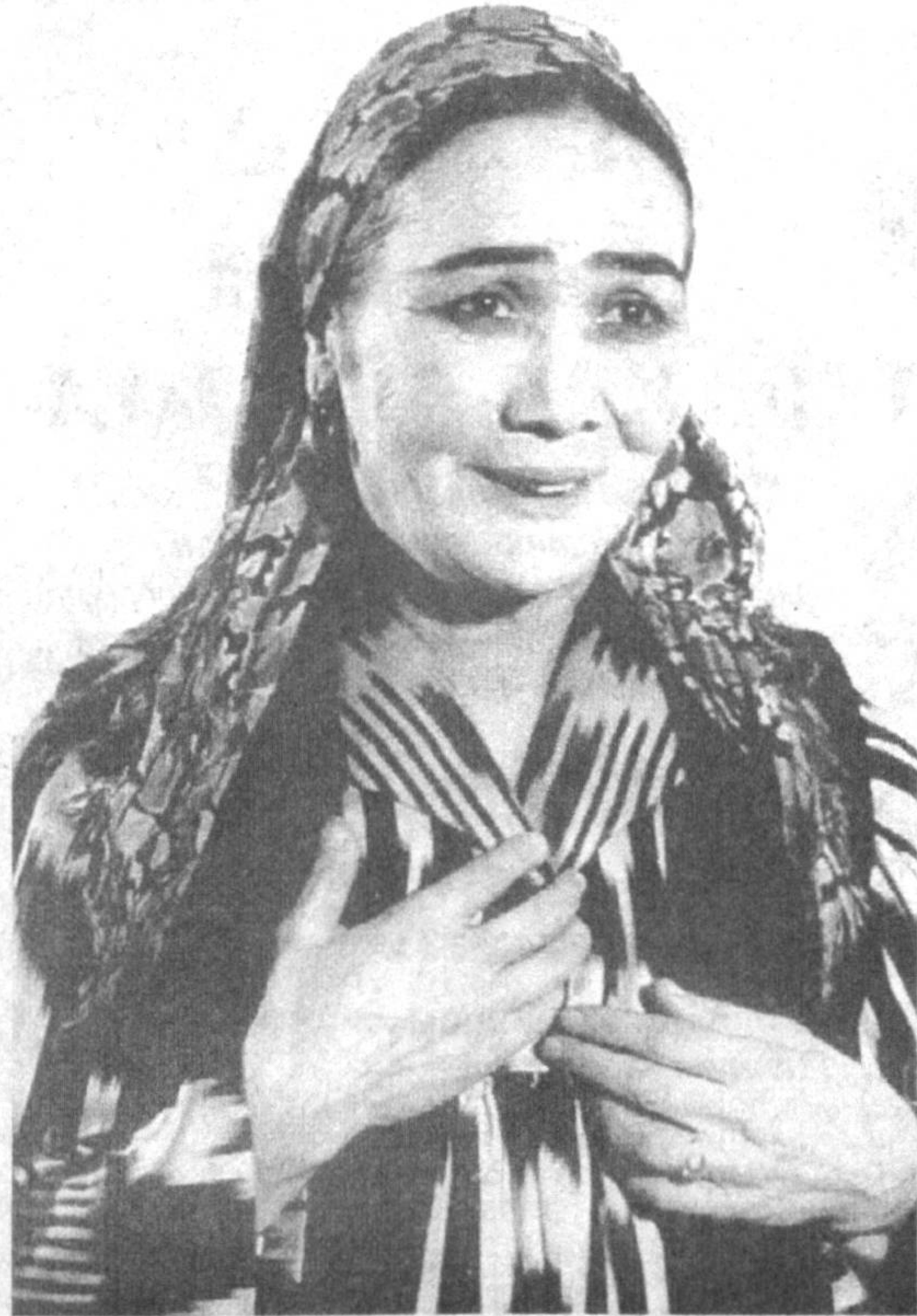
Ўзбек театр ва кино санъати юлдузларидан бири — Лутфихоним ая Саримсоқовадан бутун республикамизда танимайдиган, унинг юксак санъатини қадрламайдиган, эъзозламайдиган киши топилмасе керак.

Ая деганимизда кўз олдимизга албатта юзларидан нур ва меҳр ёғилиб турган ҳақиқий ўзбек оналари тимсолидаги Лутфихоним ая Саримсоқова гавдаланади. Ая ижросидаги театр ёки кинолар «ойнаи жаҳон» орқали намойиш қилингудек бўлса, каттақо кичик жон дили билан томоша қилиши аниқ.