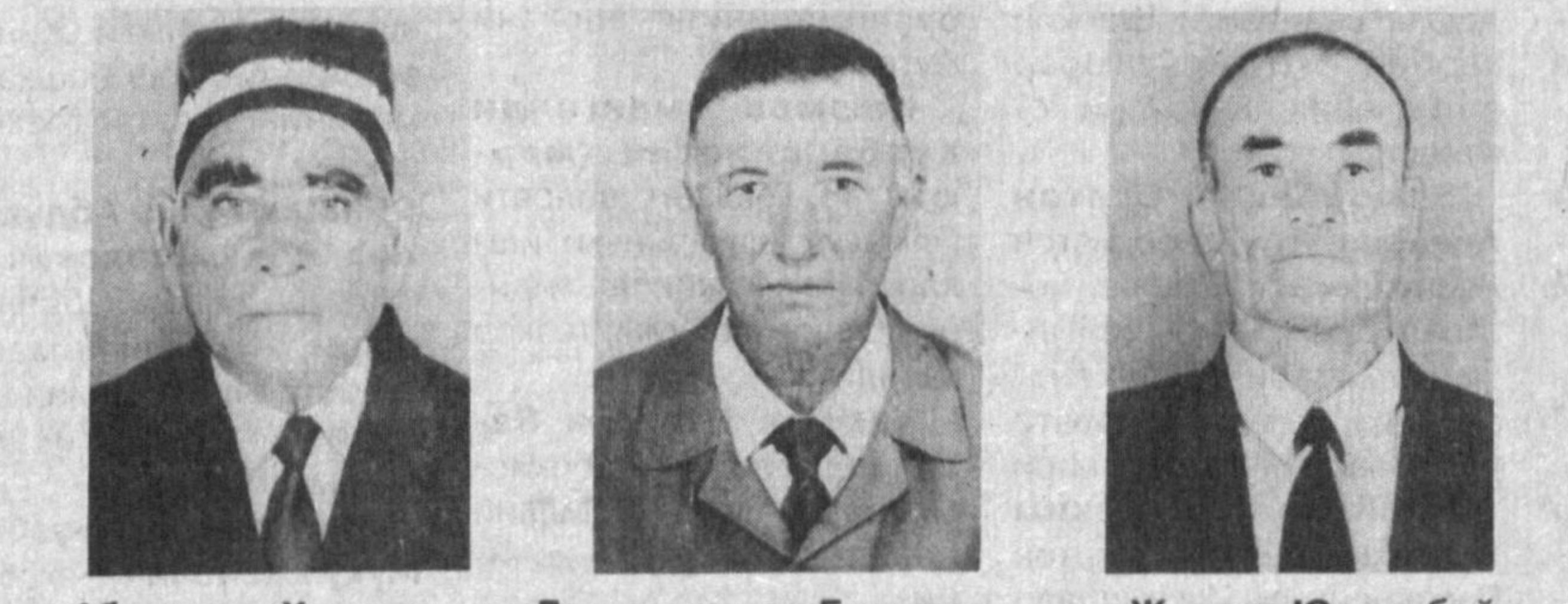
Аблакулов Ҳазрат Джуманиязов Бекдурди Жураев Юрсинбой

Ўзбекистон Республикаси Президенти Тошкент шаҳри, 2000 йил 25 август. И. КАРИМОВ