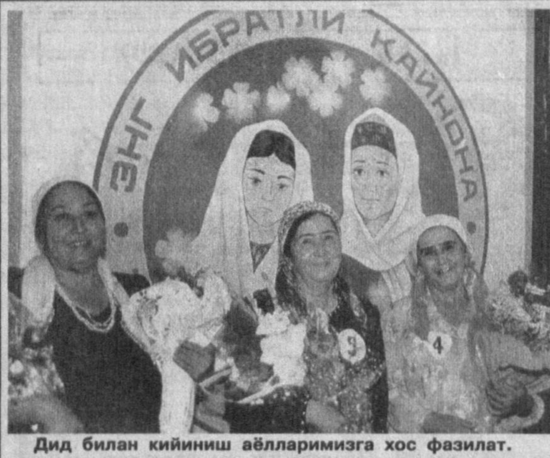
Дид билан кийиниш аёлларимизга хос фазилат.