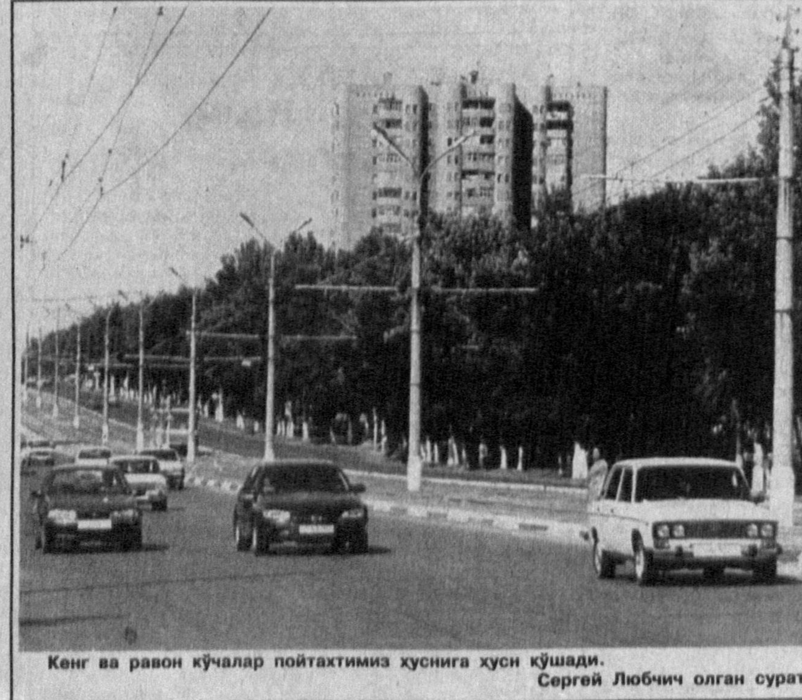
Кенг ва раён кўчалар пойтахтимиз хуснига хуси кўшади.

Ёдингизда бўлса, азиз ҳамшаҳар, бундан 2-3 йил муқаддам сариқ касаллиги билан оғриганлар сони кўпчиликини ташкил этганди. Ёки айрим газетлар ташвиш билан хабар берганидек, кейинги пайтларда эхиноккоз ва бошқа хасталикларга чалинаётганларнинг орамизда учраётгани, айрим ҳолларда фуқароларнинг шу касалликлар туйғайли бир умр майиб-мажруҳ бўлиб қолаётганларига сабаб нима?