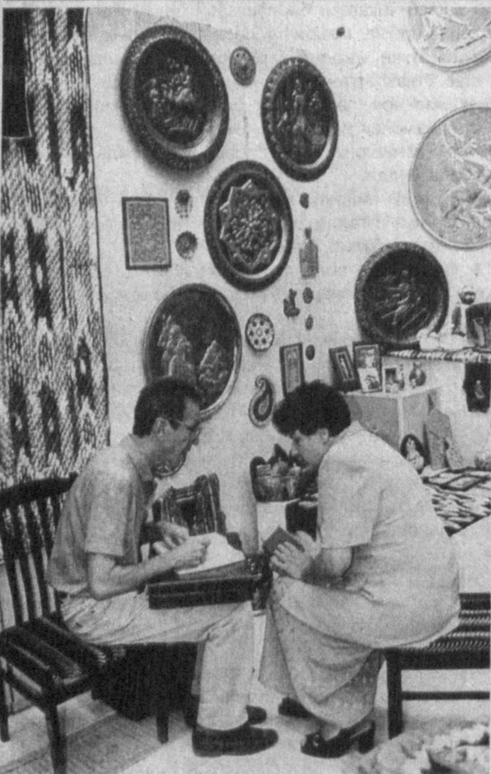
Хунармандлар кўргазмасида.

Бемор қанча барвақт аниқла-ниб касалхонага ётқизилса, жой-