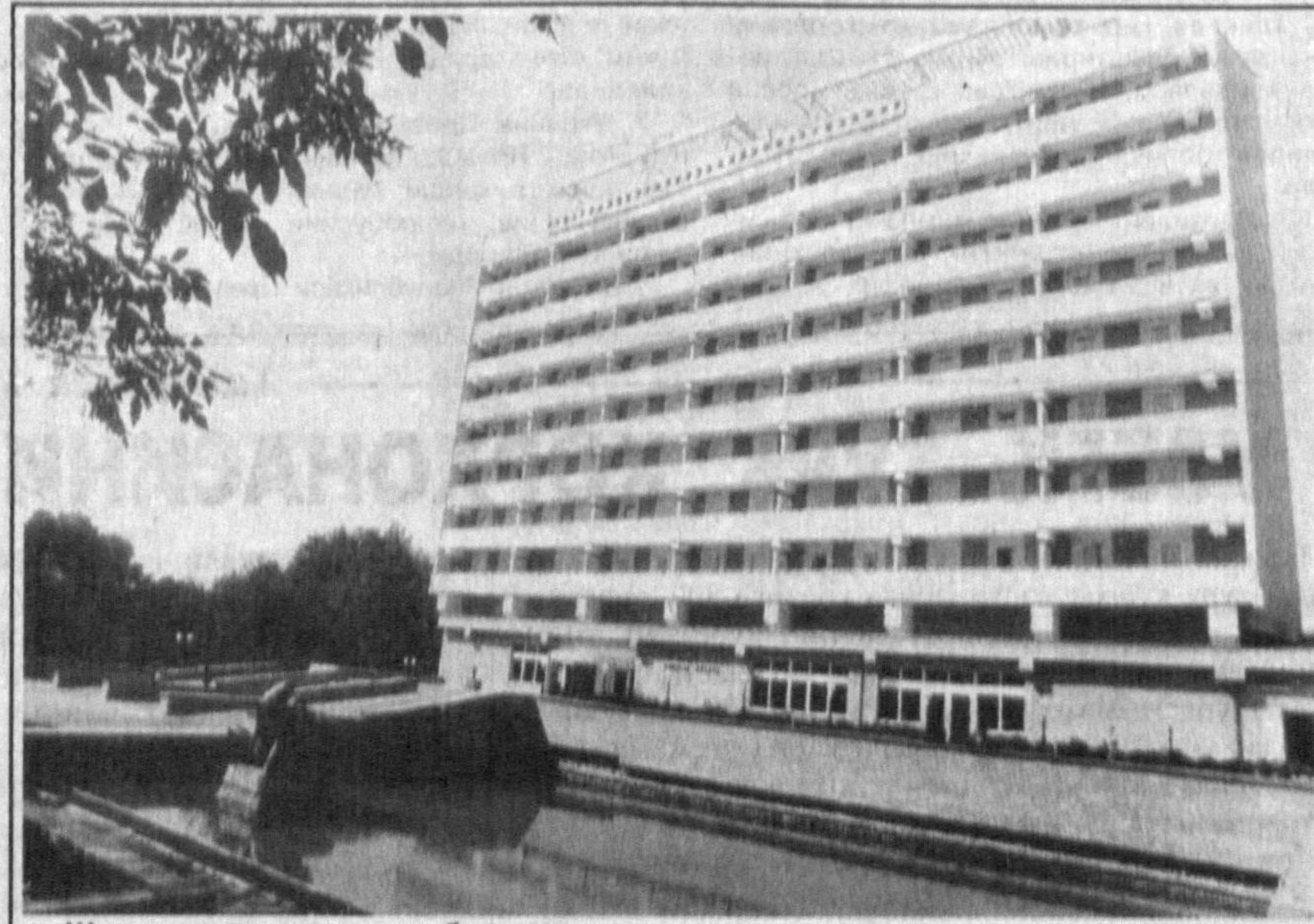
Шаҳримизга ярашқили бинолар.