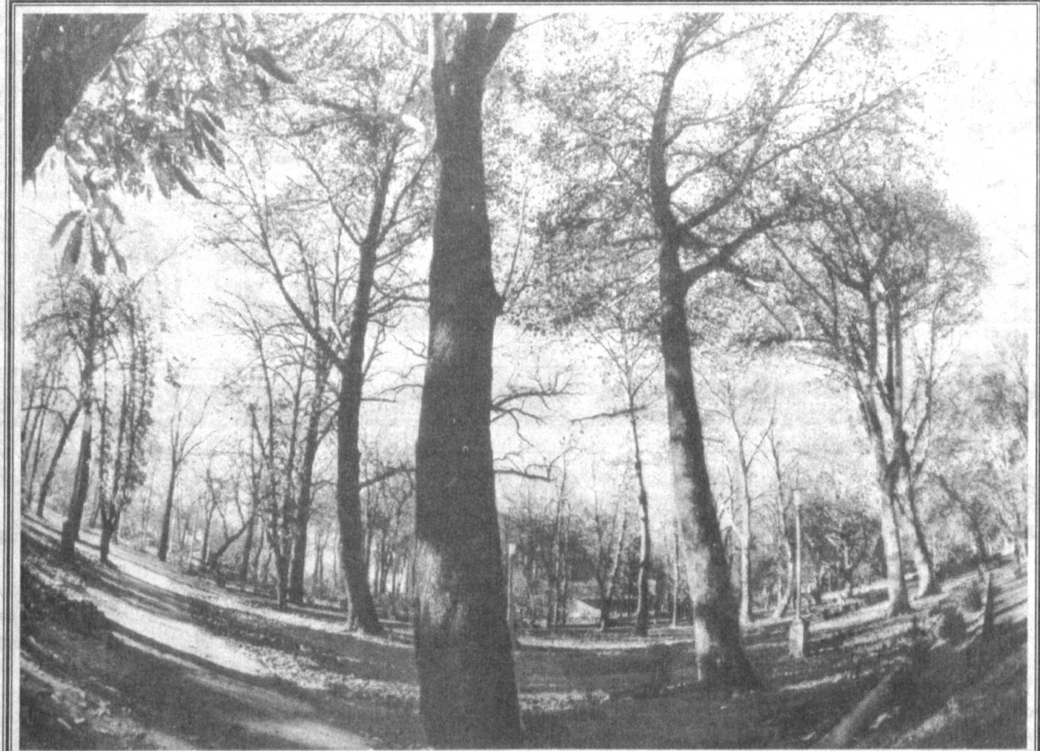
Азиз ҳамшаҳар, куйида эйтиборингизга ҳавола этилажак мақола сабаб бундан уч йил муқаддам содир бўлган воқеа ёдига тушди.

Маълумки, пойтахтимиз мустақиллик шарофати туфайли кундан-кунга қирой очиб, гўзаллашиб бормоқда. Чунки янгидан қурилаётган турар жой бинолари, гузарлар, муҳташам иншоотлар тан олиб айтиш жоизки, Тошкентимиз ҳусну тароватини бутунлай ўзгартириб юборди. Хусусан, Себзор, Чорсу даҳаларида бунёд этилган анги маҳаллалар, кўчалар, кўп қаватли иморатларни кўрганда ҳар сафар кишининг баҳри-дили очилади. Мен Чорсуни бежизга эсламадим. Чунки бу ерда қариндошлар истикомат қилишарди. Очиғини айтганда бор-йўғи уч-тўрт сотихли, эски пахта ҳам ховлида яшашарди. Янги объектлар қурилиши олдида бу ховли-жойларни бузишга тўғри келди. Лекин, чоррок ховли бўлсада шу ерга мевали кўчатлар, ҳар хил кўчатлар, району жамбилдан тортиб экадиган қариндошларимиз ҳадеганда ховлини бўшатигача рози бўлишарди. Кўчаларнинг бирида шу ерларга йўлим тушди-ю, қариндошларимни кўргани кирдим. 75 ёшни қоралаган холамиз ҳасрат қилиб кетдилар: