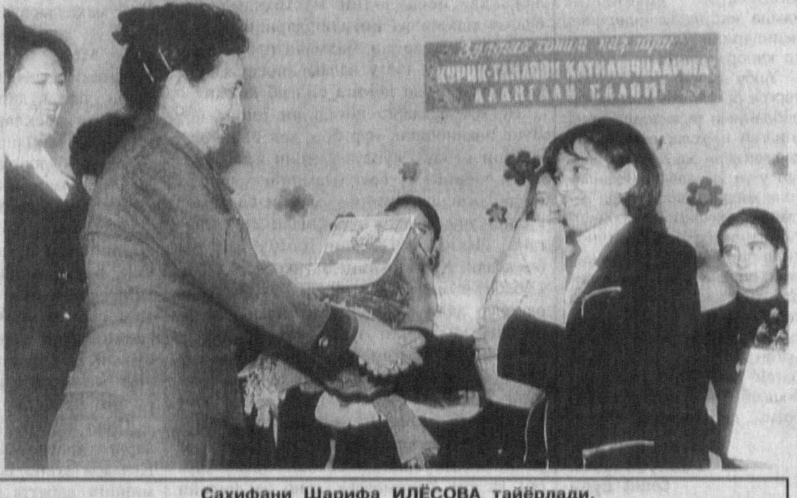
Саҳифани Шарифа ИЛЁСОВА тайёрлади.