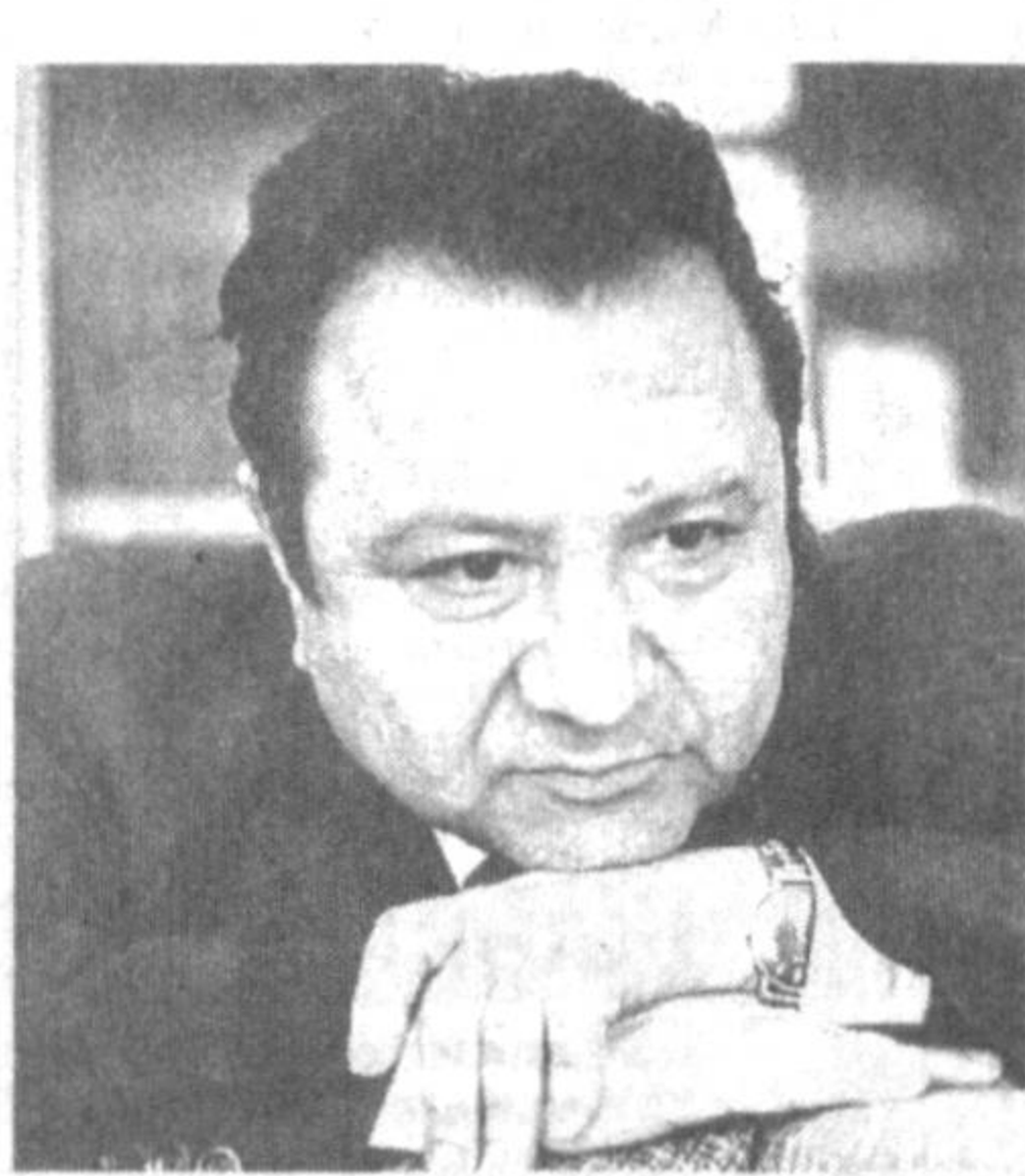
Жуманиёз ЖАББОРОВ, Ўзбекистон халқ шоири