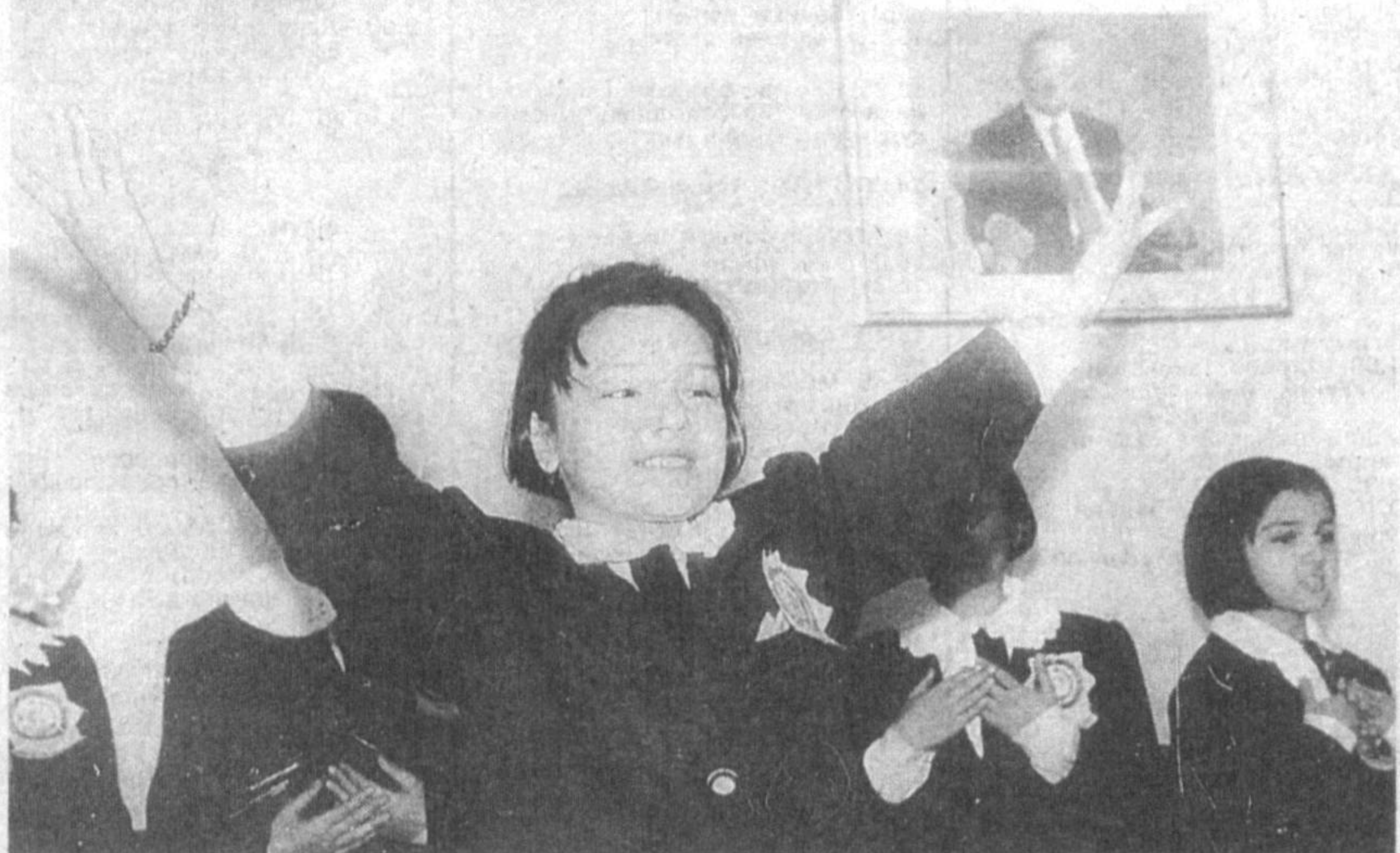
Она Ватан ҳақидаги шеър...