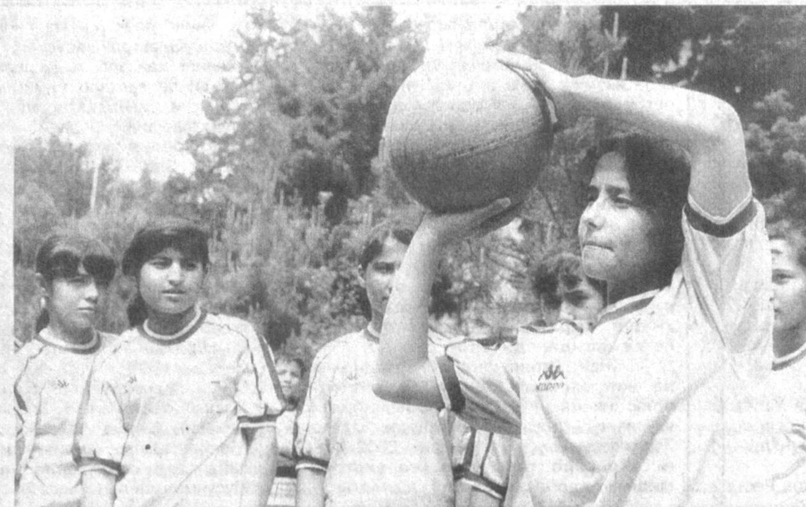
Ёш баскетболчилар.