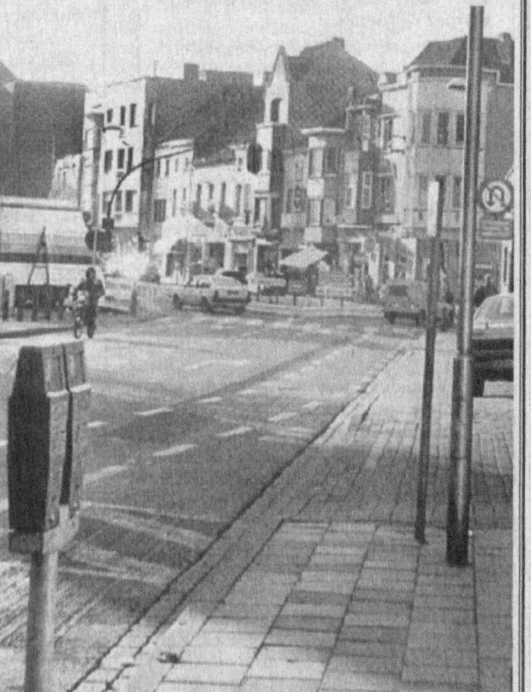
лантириш масалалари муҳофиза қилиниши ва 2000 йилнинг 7-июлида Тошкент билан Кортрейк ўртасидаги режалар тўғрисидаги протоколга имзо чекилди. Ана шу ҳужжатда икки томонлама иқтисодий муносабатларни ривожлантиришнинг устувор жиҳатлари, биринчи навбатда тўқимачилик саноятини ривожлантириш режалари қайд қилиб қўйилди. Маълумки, Бельгия тўқимачилик ишлаб чиқаришини ривожлантириш борасида кўп асрлик таърибага эга бўлган мамлакат бўлиб бу ерда тайёрланган тўқимачилик буюмларининг ажойиб намуналари Буюк Ипақ йўли давраларига бориб тақалди. Тошкент учун ҳам тўқимачилик саноти яқинда алоҳида қизиқиш ётаётган. Шу жиҳатдан олиб қараганда протоколда Кортрейкнинг ўз зиммасига Бельгия, Франция ва бошқа мамлакатларнинг йирик тўқимачилик фабрикаларини Тошкент тўқимачилик саноятининг имкониятларидан воқиф этажаклигини ва ҳамкорликка эришишда маддат кўрсатишини олганлиги тасодифий ҳол эмас. Бундан ташқари хар иккала шаҳар ТАСИС дастури доирасида иккита лойи-

вирга туширган Тошкент билан биродарлашган ушбу шаҳарнинг гузал манзараларини ҳамшаҳарларимиз диққатига хавола этишни лозим деб топдик.