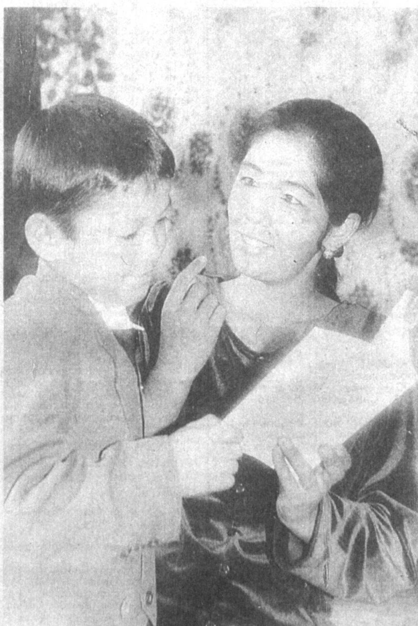
Бу китобни албатта ўқи, ўғлим...