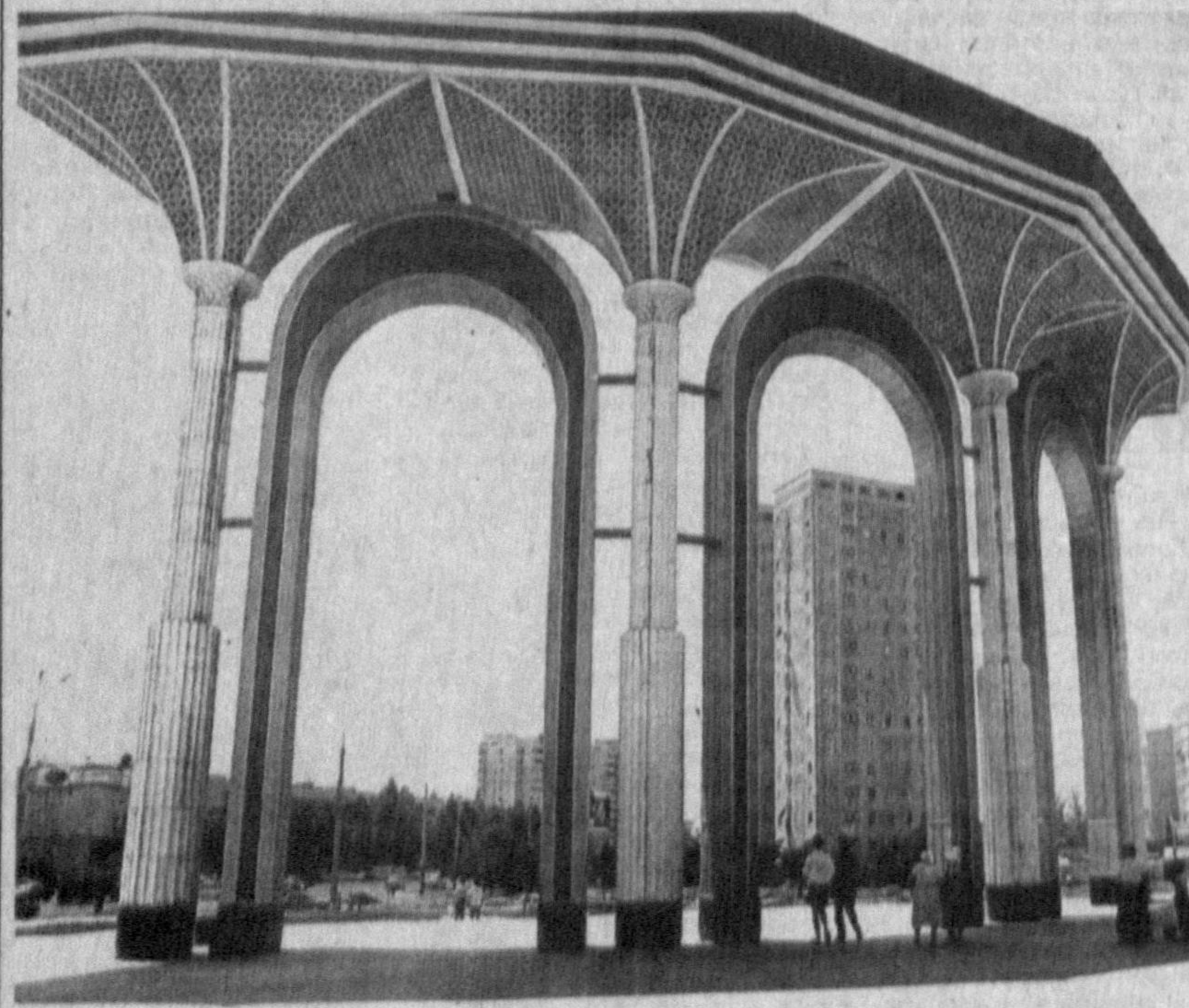
Пойтахтимиз бозорлари ҳам бири-биридан гўзал ва файзли.