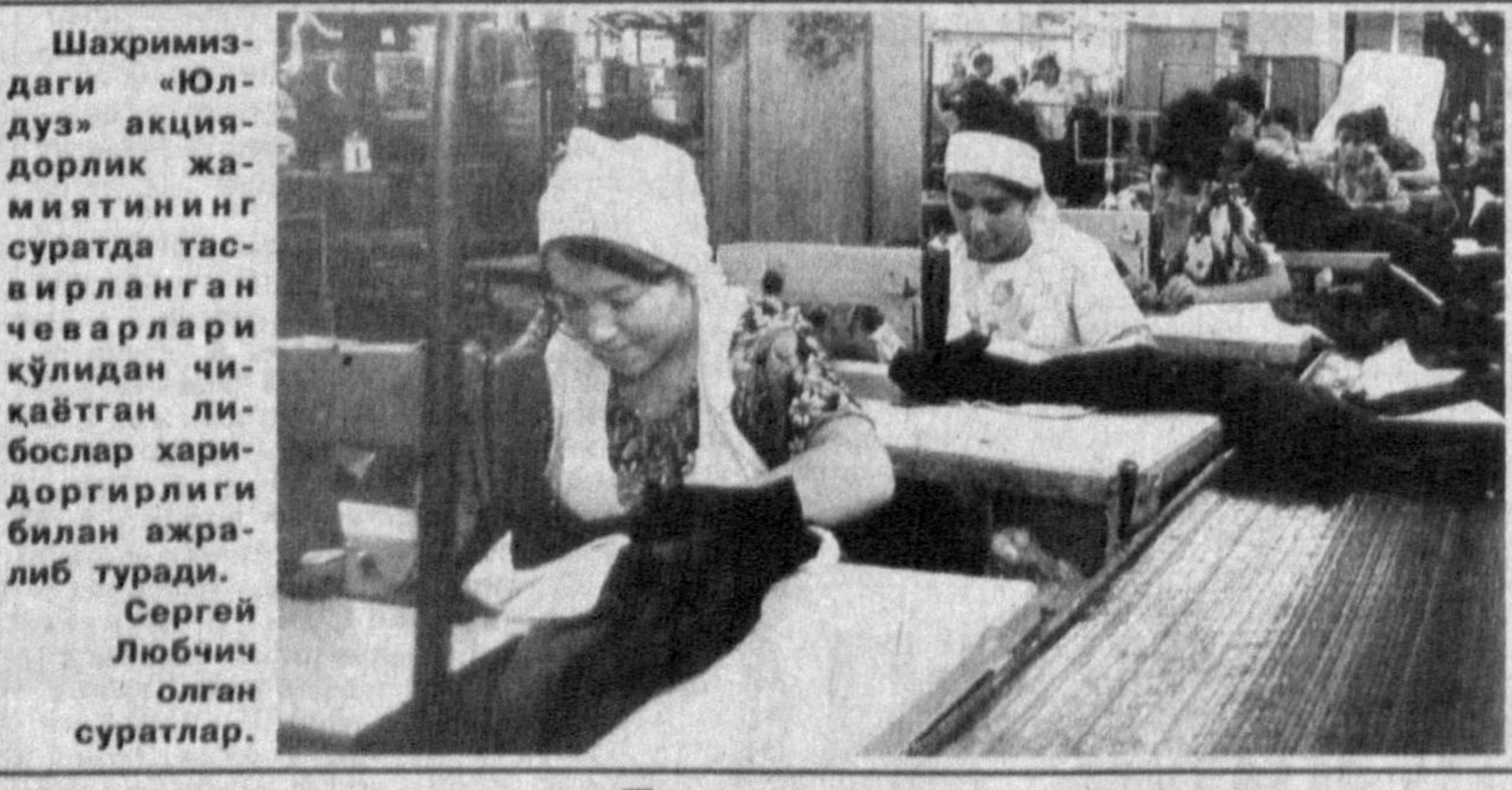
Шахримиздаги «Юлдуз» акциядорлик жамиятининг суратда тасвирланган чеварлари қўлдан чикавган либослар харидорлиғи билан ажралиб туради.