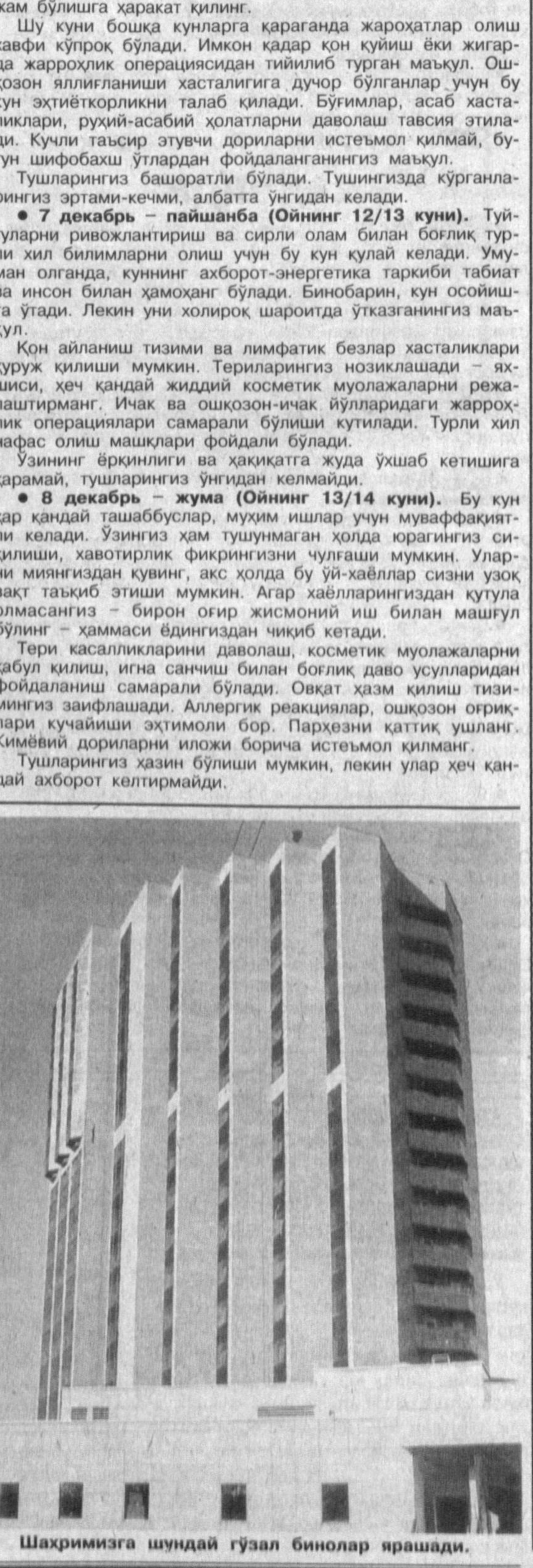
Шаҳримизга шундай гўзал бинолар ярашади.

Шабдан шабагача: мунажжим таъсиялари ҲАФТАНГИВ ХАЙРЛИ КЕЛСИН