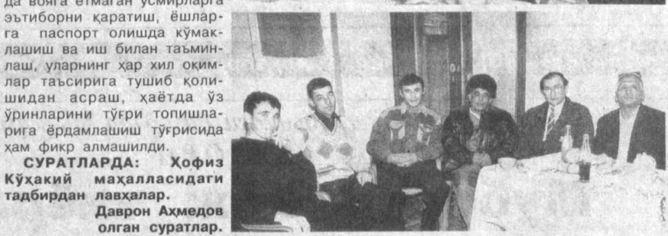
СУРАТЛАРДА: Ҳофиз Кўхакий маҳалласидаги тадбирдан мухлислари.