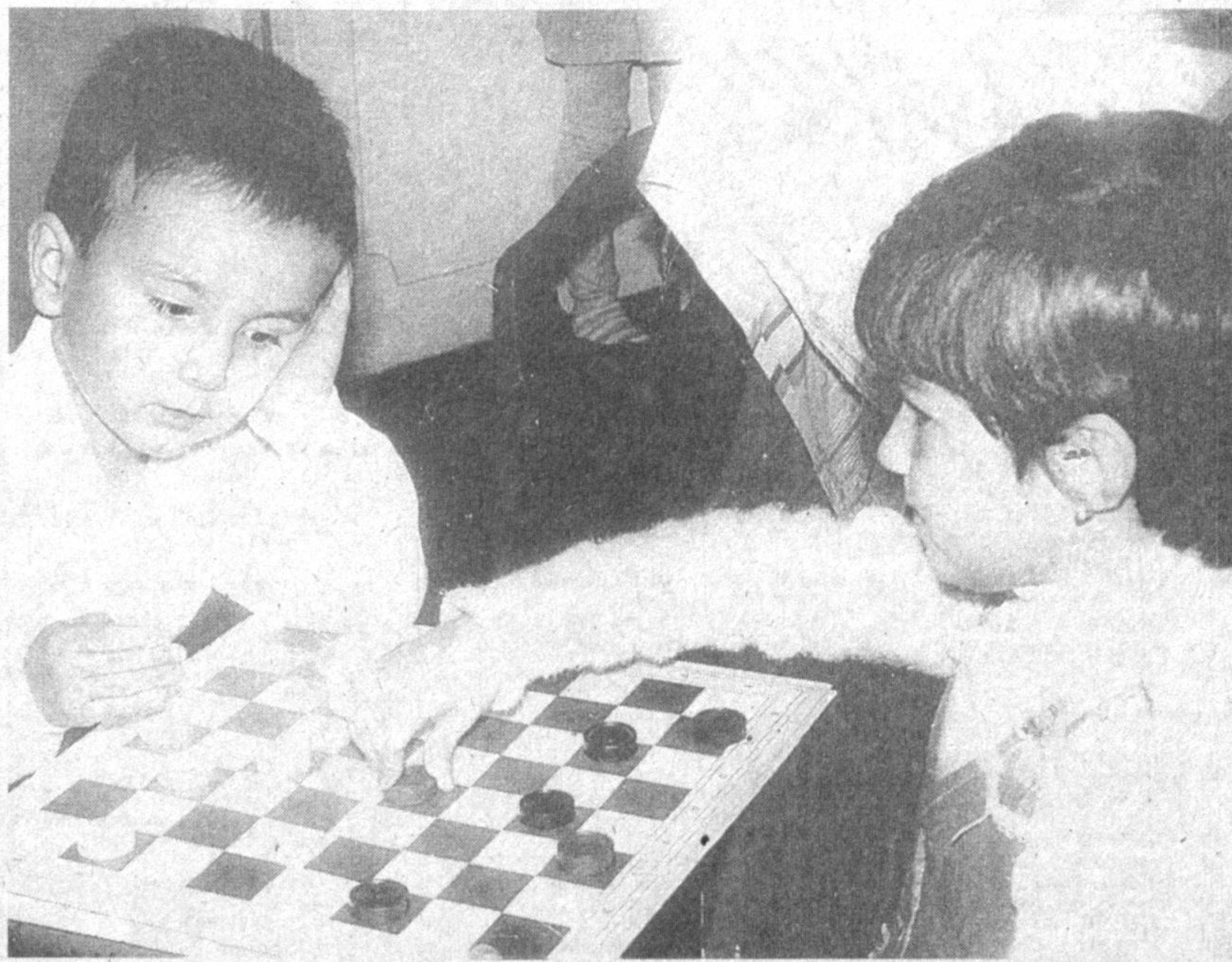
Қандай юрсам экан...