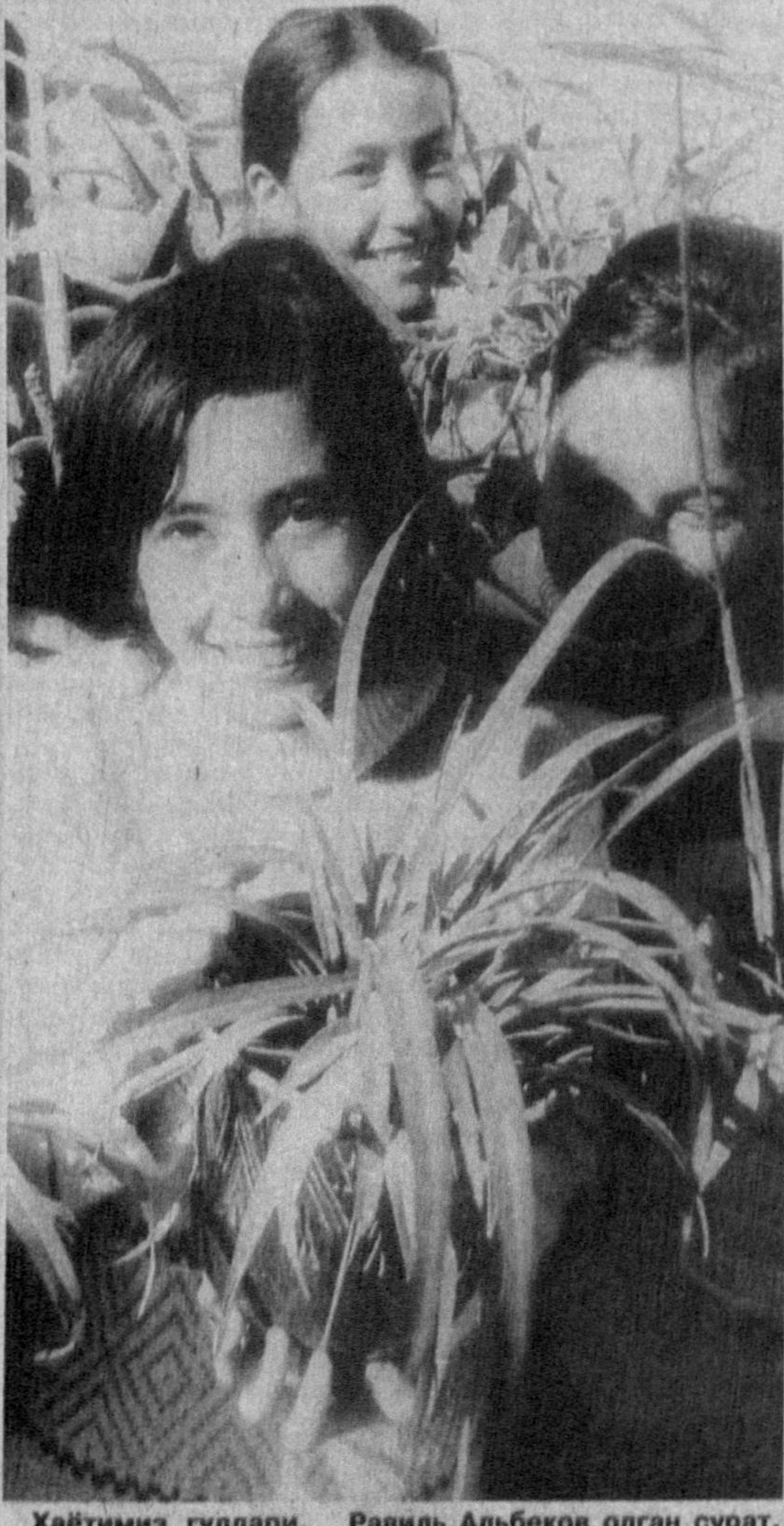
Ҳаётимиз гуллари.