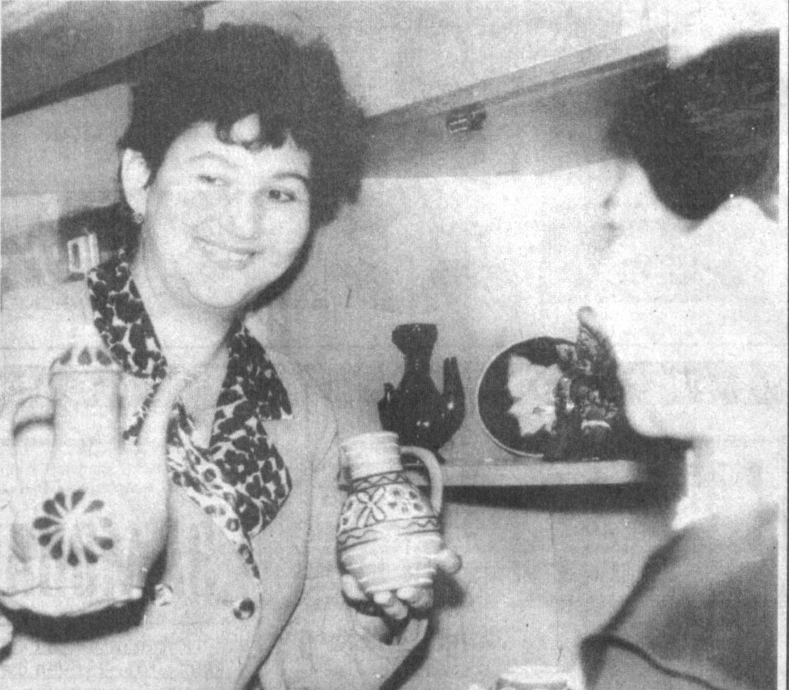
Кулолларимиз қўлидан чиққан буюмлар барчани лол қолдиради.