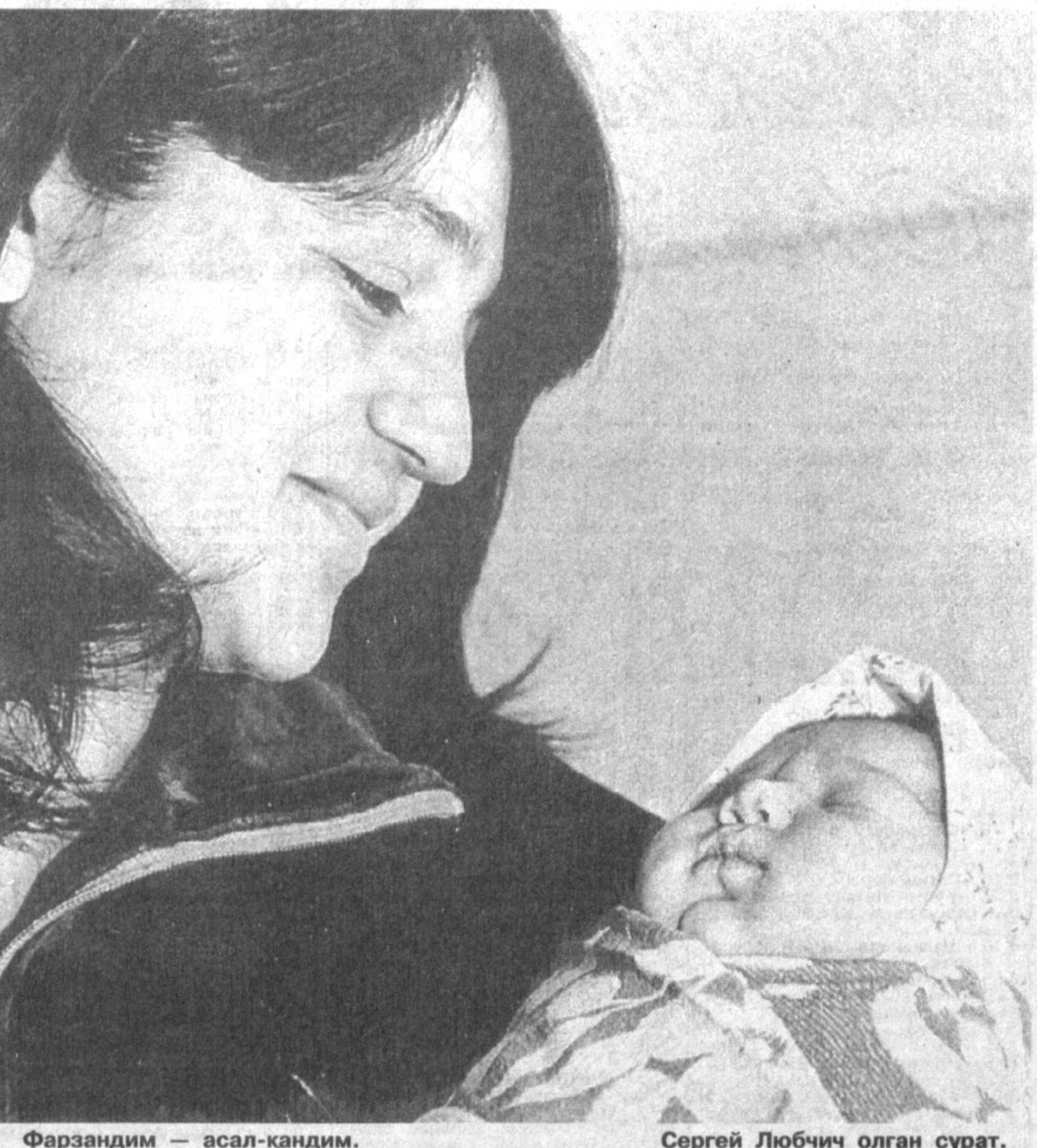
Фарзандим — асал-қандим.