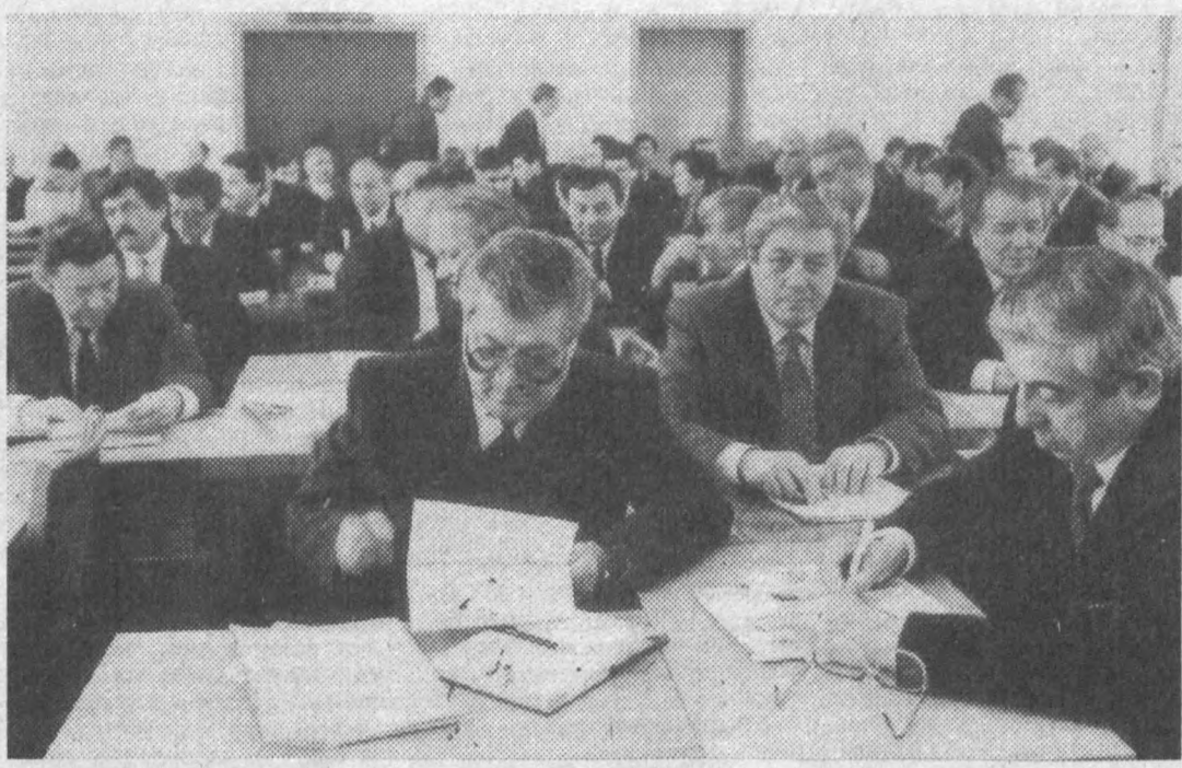
СУРАТЛАРДА: йиғилиш пайти.