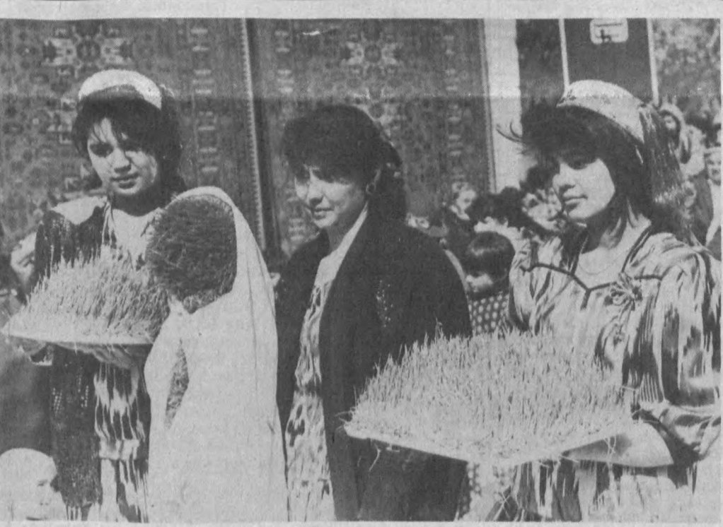
Ундирилган бугдой Наврўз — янги кун, тўқилик, тўқчилик рамзидир. Айниқса у навқирон қизларимиз қўлида ёшлик нафасини тартиб янада ўзгача жилоланади.

дилар, бағоят қизиқарли материаллар тўпладилар. Тарихчи, филолог, тилшу-нос, маданиятшунос олимлар ҳамда жур-налистларнинг изланишлари оқибат-на-тижалари қамраб олинган бир неча ян-ги китоблар қор этлиди ва яна бир не-чта асарлар нашрдан чиқиш арафасида турбди. Ҳаётимизда Амир Темурийнинг 660 йиллигини бутун дунё кенг нишонлаш тарадууди билан яшамоқда.