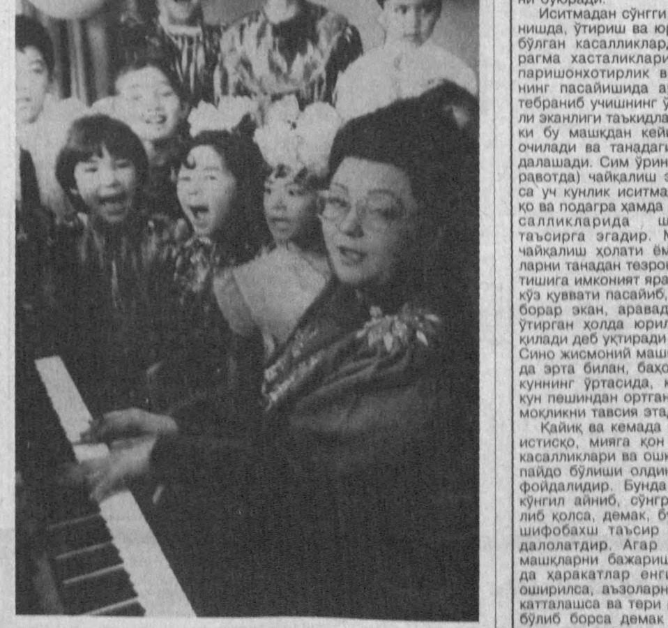
Юнусовд туманидаги Раззоқ Ҳамроев номи мактабда ёш авлодини қўшиқ ва мусиқа санъатига ўратиб ишлари кўши йўлга қўйилган. Машиқулотларни таърибали мусиқа ўқитувчиси Гули Соттибеова олиб боради. Суратда: навбатдаги мусиқа дарси.