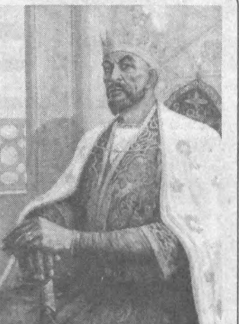
Шундай бир пайт қилайликки, ҳаммаша юртимиз оспони чарогон бўлсин.

Бунинг учун қилинадиган ишлар режалаштириб олинди. Масалан, барча туманлардаги маҳаллаларда, ундан ташқари мактаб, институт қорхона ва ташкилотларда «Маданиятимиз, маданий меросимиз» ва «давр» мавзудида Амир Темур