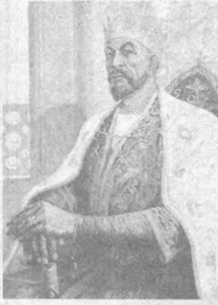
Буюк салтанатни тиклади