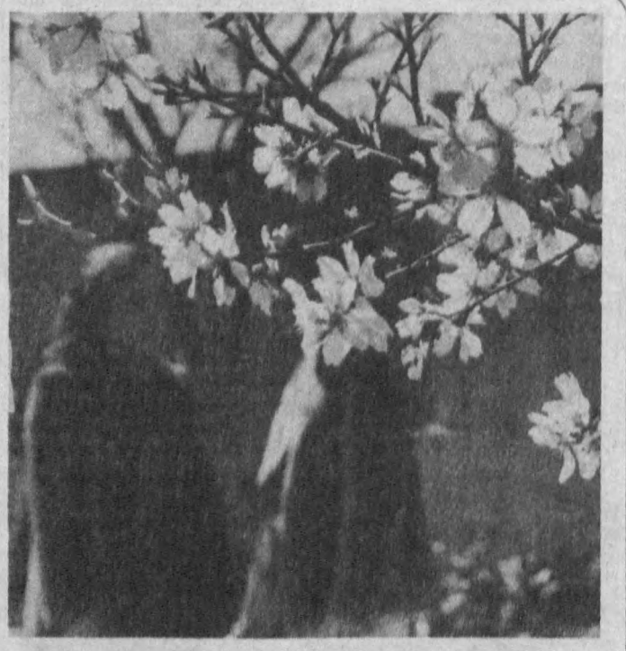
«Повдаларни бегаб гулчалар...»