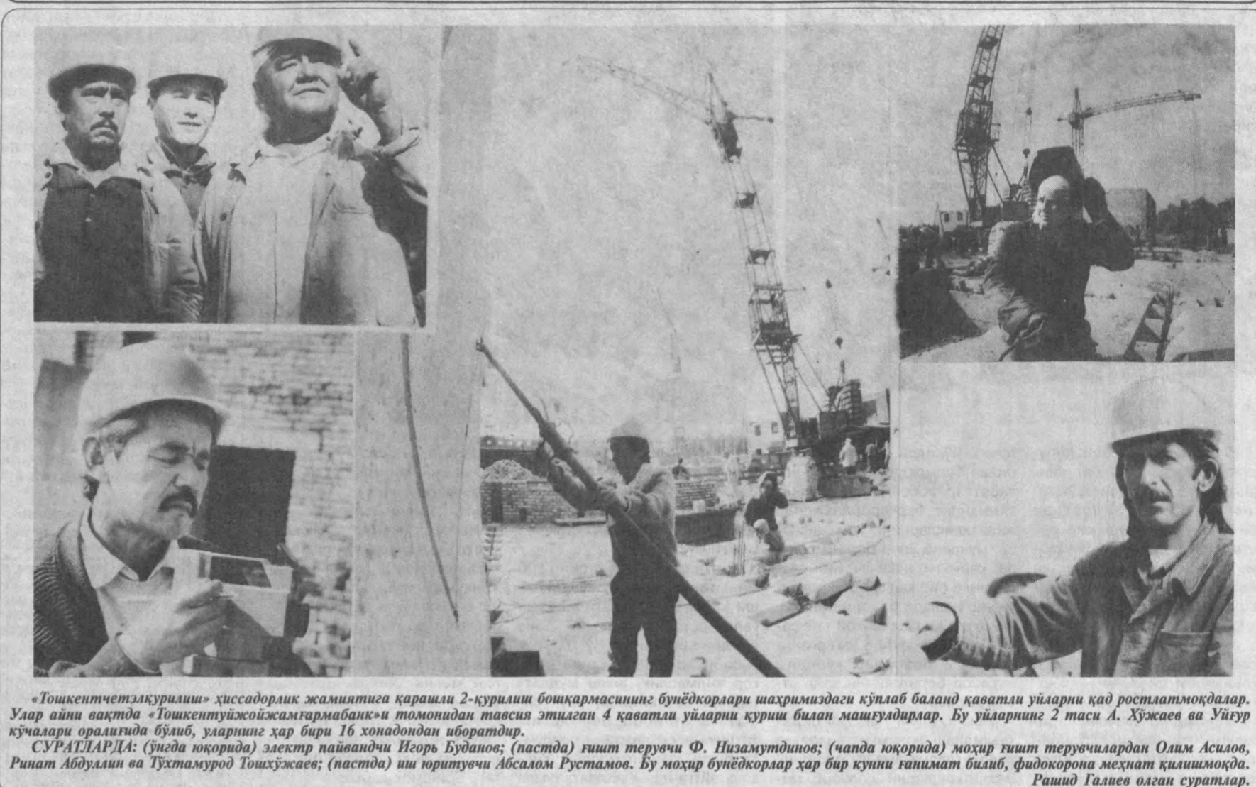
«Тошкентте таъкирлури»ни ҳисобдорлик жамиятига қарашли 2-қўрилиш бошқармасининг бўёқкорлари шахримизда сўлаб баланд қаavatли уйлари қад ростлатмоқдалар. Улар айни вақтда «Тошкентте таъкирлури»ни ҳисобдорлик жамиятига қарашли 4 қаavatли уйлари қурши билан машғуддилар. Бу уйлари 2 таси А. Хўжаев ва Уйгур кўчалари оралиғида бўлиб, уларнинг ҳар бири 16 хонадондан иборатдир.