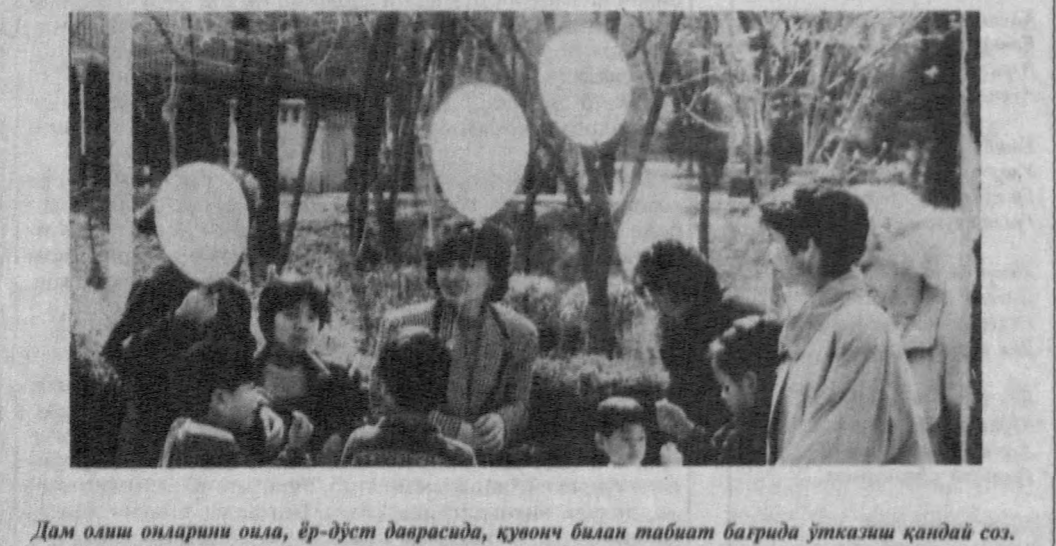
Дам олиш оиларини оила, ёр-дўст даврасида, қуноч билан табиат бағрида ўтказиш қандай соҳ.