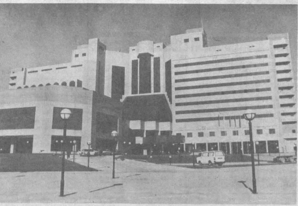
«Тошкентленд» ёнида яқинда фойдаланишга топширилган халқаро тоифадаги «Интерконтинентал — Тошкент» меҳмонхонаси ҳам, шубҳасиз, шаҳримизнинг энг кўркем иншоотларидан бири бўлиб қолади.

Ушбу беш юлдузли меҳмонхонанинг қурилиши 1992 йилнинг март ойида Узбекистон Республикаси Вазирлар Маҳкамасининг «Республикада халқаро савдо объектлари мажмуасини ташкил этиш тўғрисида»ги қарорига мувофиқ бошланганди, — дейди Узбекистон Республикаси ташқи иқтисодий алоқалар вазирлиги капитал қурилиш бош бошқармасининг бошлиғи Евгений Цой. — Кейинчалик бу иншоот халқаро савдо-кўргазма объекти деб номланди ва унинг таркибига меҳмонхонадан ташқари маданий-соғломлаштириш, савдо, бизнес ва ахборот марказлари, шунингдек, миллий банк биноси ҳам киритилди.