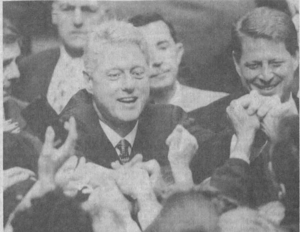
Кеча Америка Қўшма Штатларида президент сайловлари бўлиб ўтди. Давлат раҳбари лавозими учун асосий кураш ҳозир Президент Билл Клинтон билан республикачилар етакчиси Боб Дубуэ ўртасида бўлди. СУРАТДА: АКШ Президенти Билл Клинтон ва вице-президент Ал Гор Портланд шаҳрида сайловчилар билан учрашувда.