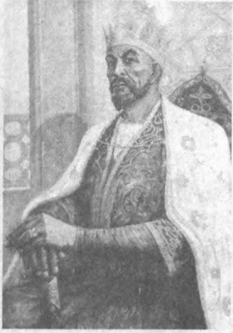
Расулаллоҳ қилган дуоси билан

Истиқбол машъалини сураб ёқалган, Боши осмон бўласин бузун ўзбекинг!