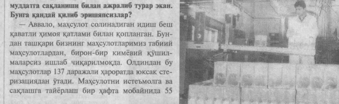
даражали ҳароратдаги инкубацион вақтдан кейин аниқланади. Тайёр маҳсулот лаборатория шароитларида текширувдан ўтказилгач, у савдо тармоқларида жўнатилади. Шу боисдан бу маҳсулотларни совутилган камераларда сақлашга ҳам ҳўжат қолмайтир...

— Аввало, маҳсулот солинадиган идиш беш қаватли ҳимоя қатлами билан қопланган. Бундан ташқари бизнинг маҳсулотларимиз табиий маҳсулотлардан, бирон-бир кимёвий қўшилмаларсиз ишлаб чиқарилмоқда. Оқдиндан бу маҳсулотлар 137 даражали ҳароратда юксак стерилизациядан ўтади. Маҳсулотни истеъмолга ва сақлашга тайёрлаш бир ҳафта мобайнида 55