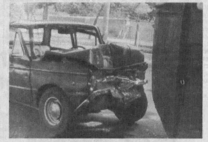
Шаҳар кўчаларида эҳтиётсизлик мана шундай аяқчи оқибатларга олиб келади.