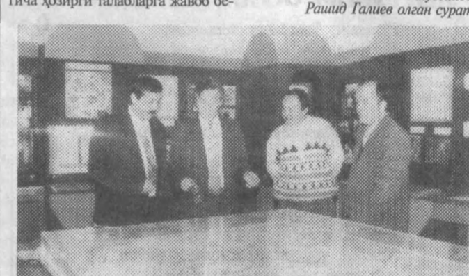
СУРАТДА: телефонлар тарихи музейида.

Тошкент телефон алоқаси ва радиолоштириш ишлаб чиқариш бирлашмасида очилди. Бундан роппа-роса 110 йил муқаддам Тошкентда илк бор телефон тўғрисида гапирилди, дастлабки телефон станцияси эса 1904 йилда ишга туширилди.