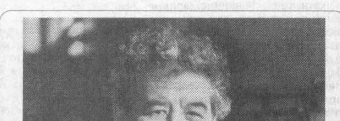
Газета 1966 йил 1 июлдан чиқа бошлаган

Бир пайтлар етти иқлимга донги кетган Тошкент трактор заводи иқтисодий таназулдан чиқиб, илгариси нуфуз ва салоҳиятини тиклай бошлади. Бу куруқ сап эмас. Корхона октябрь ойида 293 миллион сўмлик маҳсулот ишлаб чиқариб, давлат режа-