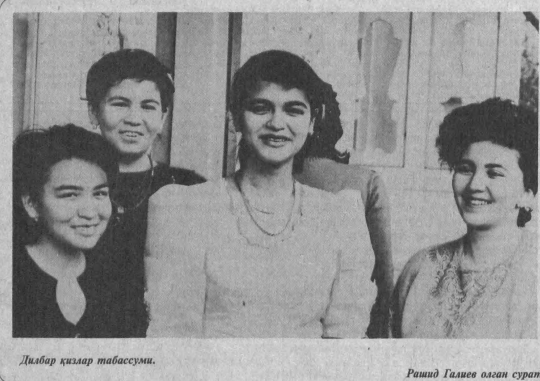
Дилбар қизлар табассуми.