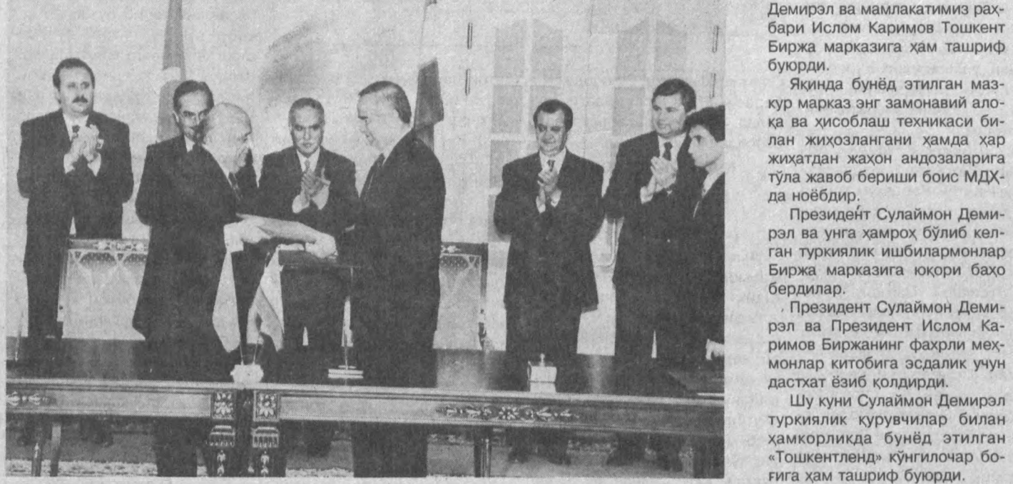
Демирал ва мамлакатимиз раҳбари Исрол Каримов Тошкент Биржа марказига ҳам ташриф бурди.

Туркия Президенти Сулаймон Демиралнинг мамлакатимизга расмий ташрифи иккинчи куни музокаралар, учрашувлар ҳамда воқеаларга гоият бой ва самарали бўлди.