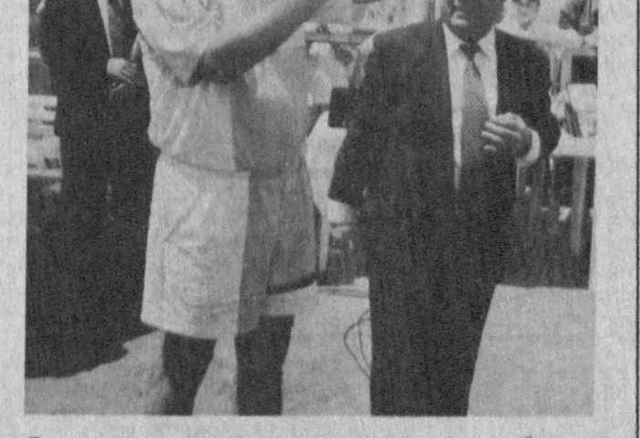
«ҲАВАС» ТУРНИРИ ЯҚУНЛАНДИ

Жанубий Африка Республикасида ирқидан қатъи назар ҳамма фуқароларга тенг ҳуқуқлар берган Конституция қабул қилинди.