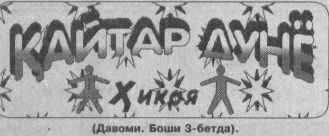
(Давоми. Боши 3-бетда).

Онасидан бемахал айрилиб зор қакшаб қолган Рохатнинг ранги сулиб, кўти ўчган, энди ун уч ёшга қадам қўйганига қарамай хийла катта ёшли кўрнарди. У меҳр ва ачинишга тўла кўзларини тикиб турган холасини кўп махтал қилмади.