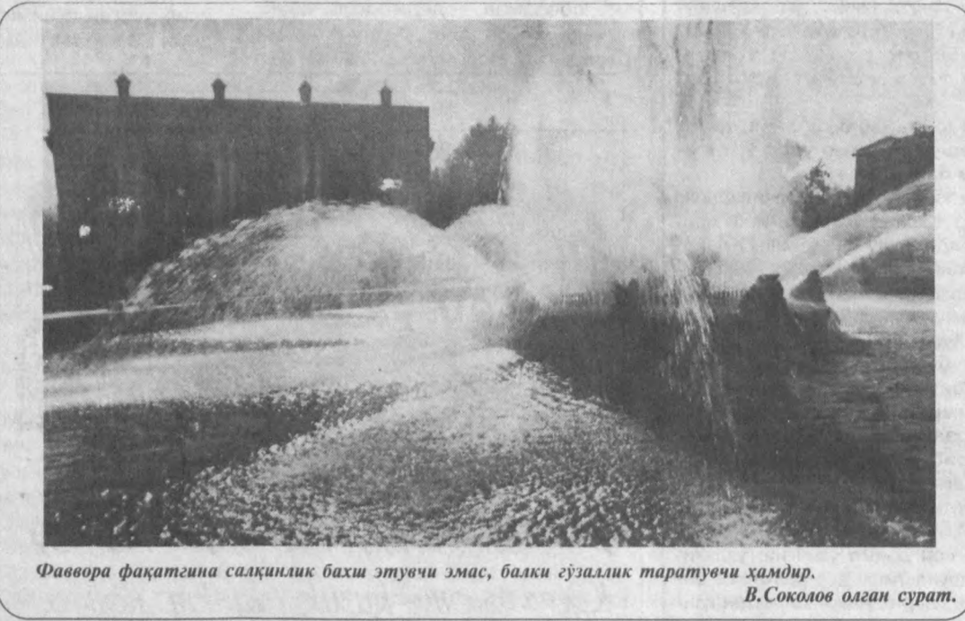
Фавора фақатгина сақлиқ бахш этувчи эмас, балки гўзаллик тартовувчи ҳамдир.