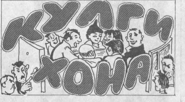
Кулинг дўстлар, умрингиз узок бўлади.