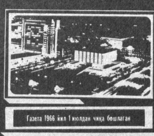
Газета 1966 йил 1 июлдан чиқа бошлаган