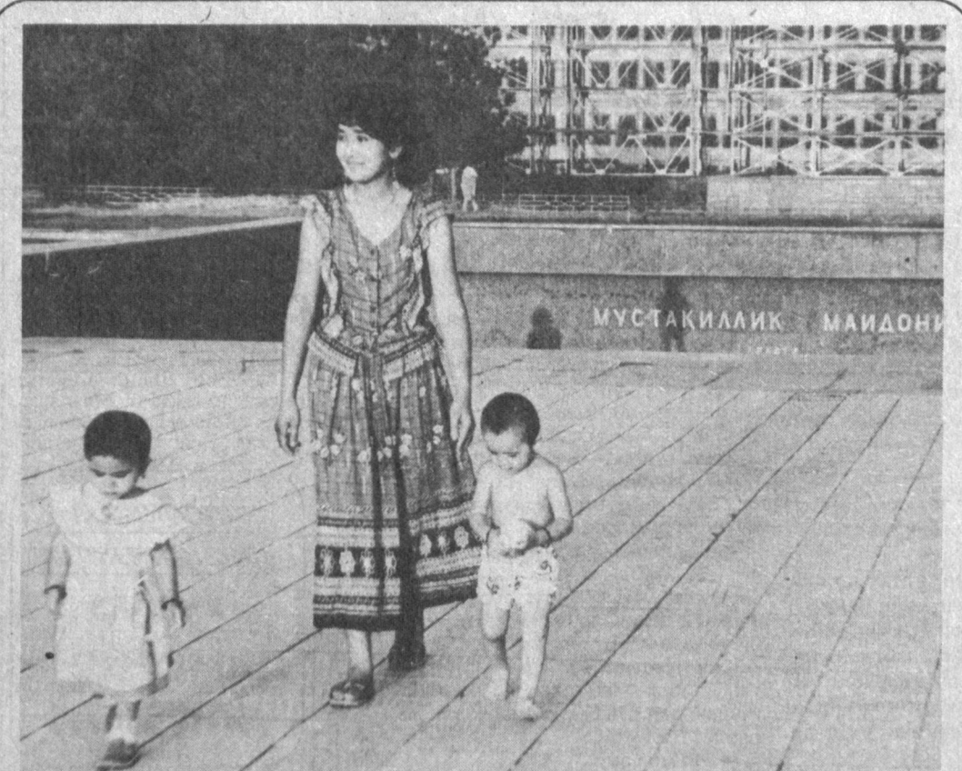
Тошкентимизнинг бош майдони — Мустақиллик майдони кун сайин чирой очиб, гўзаллашиб бормоқда. Бу ерда ўйнаб турган фарворлар, ян-яшил дараклар, осмонга парилар бир-бир билан уйғунашиб кетган. Шунинг учун бу ер керак Мустақиллик майдони ҳамшаҳарларимизнинг муқаддас зияратгоҳи ва дам оладиган гўзал маскани саналади.