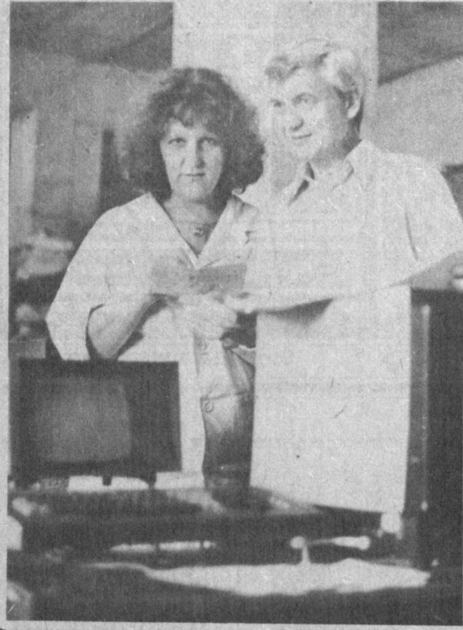
Тошкент қишлоқ хўжалик машинасозлиги ишлаб чиқариш бирлашмасида иш жараёнини автоматлаштириш учун ҳаракат қилинмоқда. Бунда замонавий техникадан фойдаланилмоқда.

Жамиятимизда 12 та цех мавжуд бўлиб, улар замонавий янги технологиялар билан таъминланди. Ун битта мебель салони дўкони-миз бор, унинг қошида кабул пунктлари ҳам мавжуд.