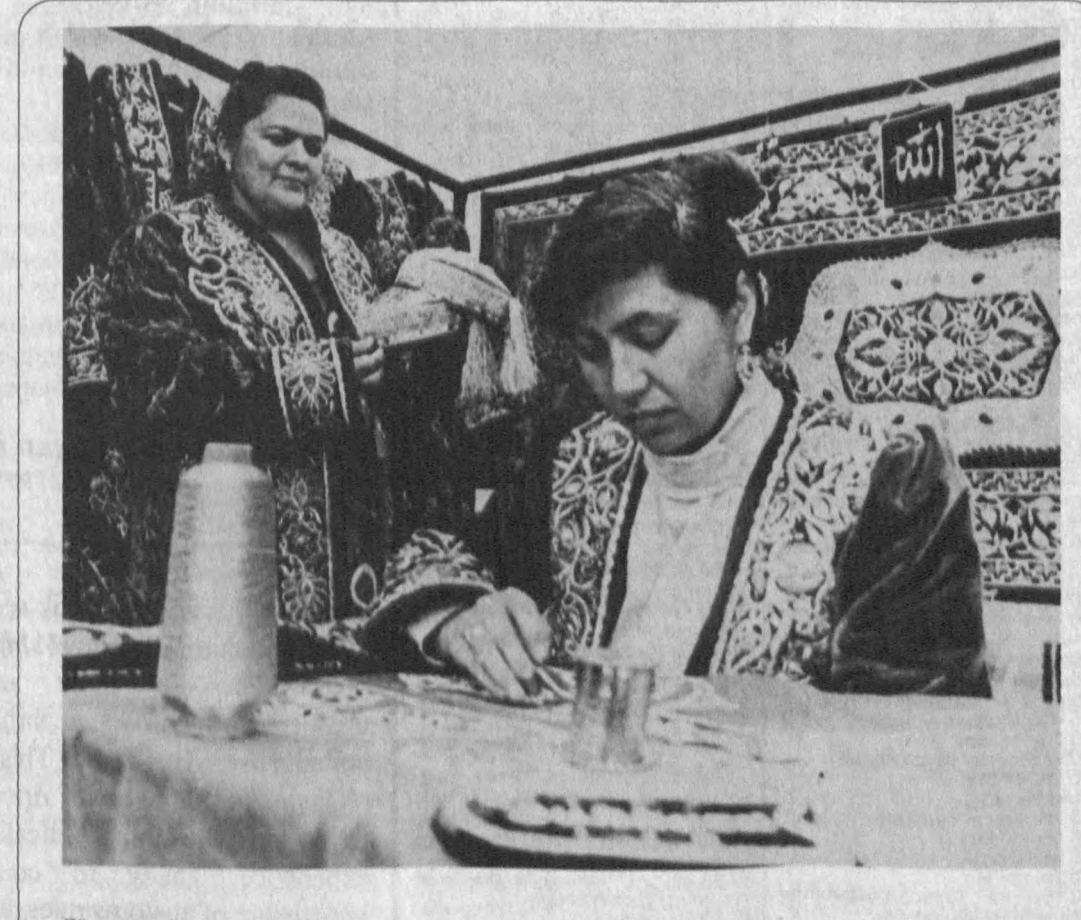
Дўппи шикдим ипақлари тиллодан, Тилло эмас, заррин, заррин матодан...