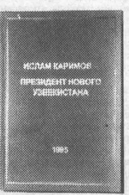
ИСОМ КАРИМОВ ПРЕЗИДЕНТ НОВОГО ЎЗБЕКИСТАНА