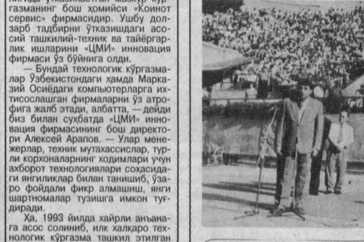
Утган кuni шаҳримиздаги «Динамо» теннис мажмуида юртимизда илк марта ўтказилган аёллар ўртасидаги челленжер мусобақаси тантанали равишда очилди.

тисодий алоқалар вазирилиги ва ташқи иқтисодий фаолият миллий банки мутахассислари, архитектор, курувчи муҳандислар гуруҳи қурилиш талаблари ва барча нормаларни таъминлаш мақсадида тайёрлов ишлари олиб боришди. — дейди капитал қурилиш бош бошқармаси бошлиғи М.Абдуллаев. — Ҳозирда меҳмонхонада асосий муаммо: уни маъмурий-бошқарув ходимлар билан таъминлаш вазифаси турибди. Албатта бу иш учун жаҳон андозаларига жавоб берадиган, юқори малакали, биринчи тоифали, бошқарув соҳасида катта тажриба бўлган операторлар керак бўлади. Уйлаймизки, бизнинг «Буйг» компанияси ҳамкорлигида олиб борадиган ишларимиз меҳмонхоналар қуриш ишлари билан чегараланиб қолмайди, балки ўзаро фойдали бошқа битимларга ҳам асос солинади. Зoir ТУРСУНОВ. СУРАТДА: Тошкент марказида қуриладиган янги меҳмонхонанинг қурилиши.