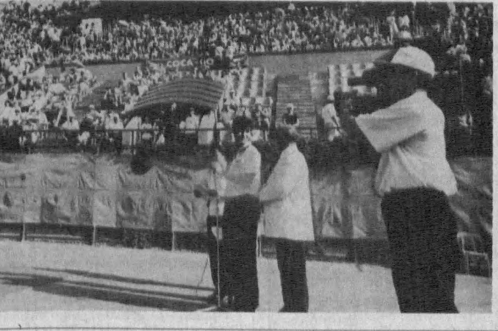
«ДИНАМО» КОРТЛАРИДА — ПРОФЕССИОНАЛЛАР