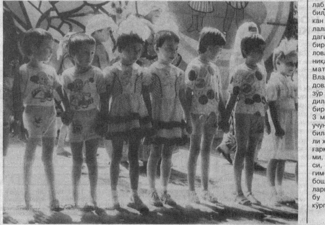
СУРАТДА: «Боғи Эрам»даги қувонч байрамдан лавҳа.