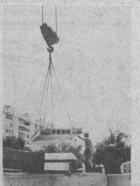
дим. Энди ўғилларим ҳам қурилишда ишлаб ҳам бўлишмапти, — дейди Абдулла ака

Юздан ортик турли касб эгалари ишлаётган қурилишда кўтаринки руҳ шундоқ сезилиб турибди. Буни ҳар бир гишт терувчи, пайвандчи ва оддий бунёдкорнинг кайфиятидан сезиб олиш қийин эмас. Бизни пайвандчилар бригадасининг бошлиғи Абдулла Самадов билан таништиришди. — Жамомасиз ўтган ойда илгорлар сафидан ўрин олади. Турли миллат вакиллари билан ташкил топган бригадамизда 21 киши ишлайди. Уларнинг тўрттаси менинг фарзандларим. Бугун Рустам, Тоҳир, Шавкат ва Шухратларнинг донги бутун участкага таралган. Улар оталари изидан бориб қурилишда ишлашга