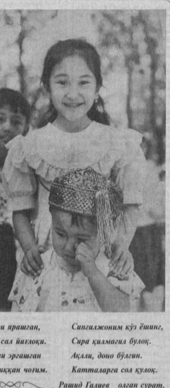
Дўпчилари ярашган, Сингилжоним кўз ёшиинг, Сингил сал йилгоқи. Эргашгани эргашган Кўчага чиққан чоғим. Рашид Галиев олган сурат.

Муаллиф ўз қиссаси орқали китобхонни оддий қишлоқ кишилари билан таништиради. Тўпламдан ўрин олган ҳикоялар кишиларни ўйлашга, ҳаёт ҳақида фикр-фалсафа қорлайди. Атрофимиздаги кимсалар, уларнинг дарди билан ўқувчини ошно этади. Муаллиф қаламга олган қаҳрамонлар нотаниш эмас, кимларгадир ўхшаб кетади. Ҳар бир китобхон ўз яқинини шу қаҳрамонлар орқали кўради. Муаллифнинг янги китоби кўпчилик қалбидан ўрин олиши шубҳасиз. Чунки тўпламда ҳаёт билан ҳамнафас воқеалар, бизга яқин бўлган қаҳрамонларнинг кечинмалари ёритилган. Салоҳиддин СИРОЖИДИНОВ.