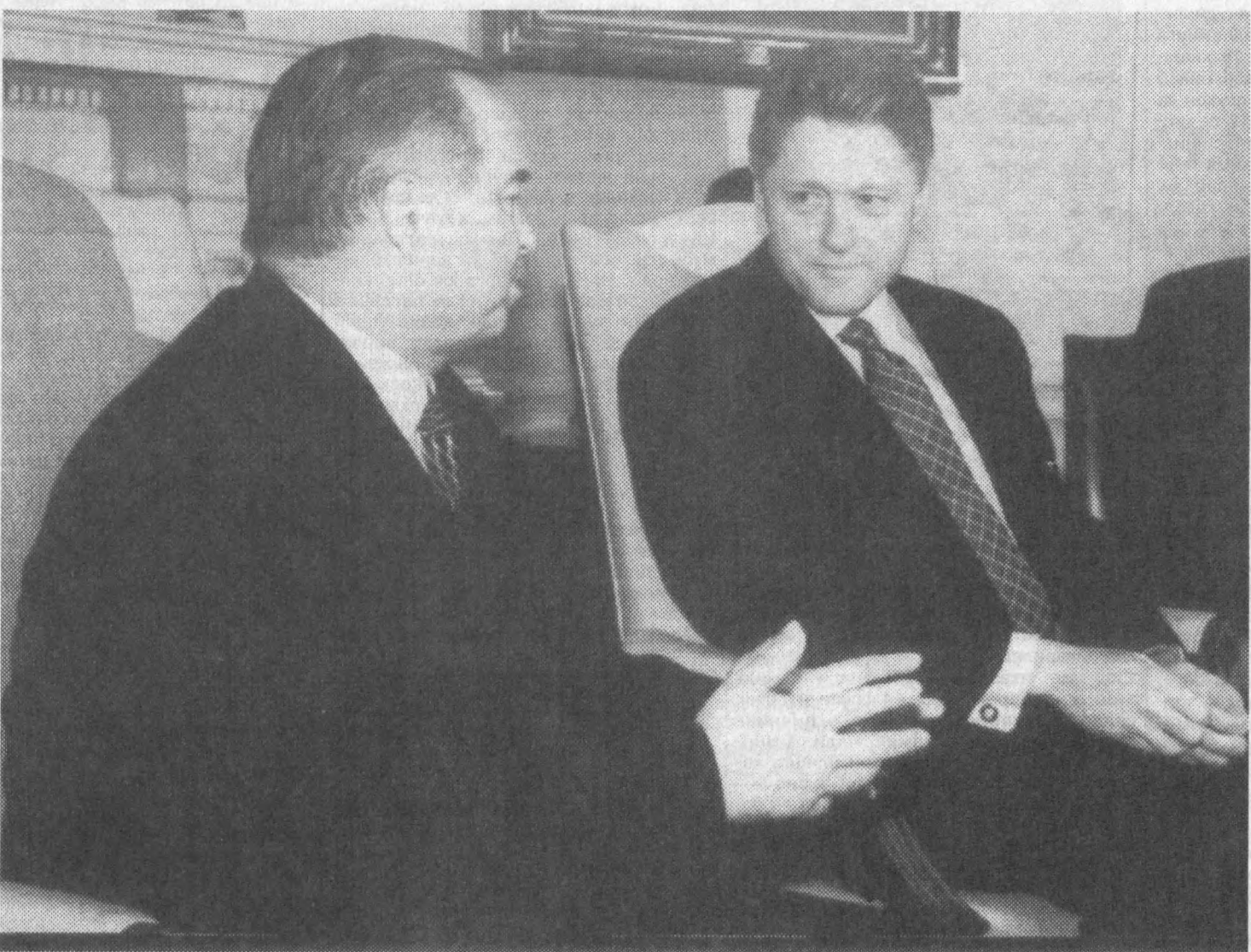
ВАШИНГТОН. 25 ИЮНЬ.

ЎЗБЕКИСТОН РЕСПУБЛИКАСИ ПРЕЗИДЕНТИ ИСЛОМ КАРИМОВ ВА АҚШ ПРЕЗИДЕНТИ БИЛЛ КЛИНТОННИНГ ОҚ УЙДА ЯККАМА-ЯККА СУХБАТИ ПАЙТИ.