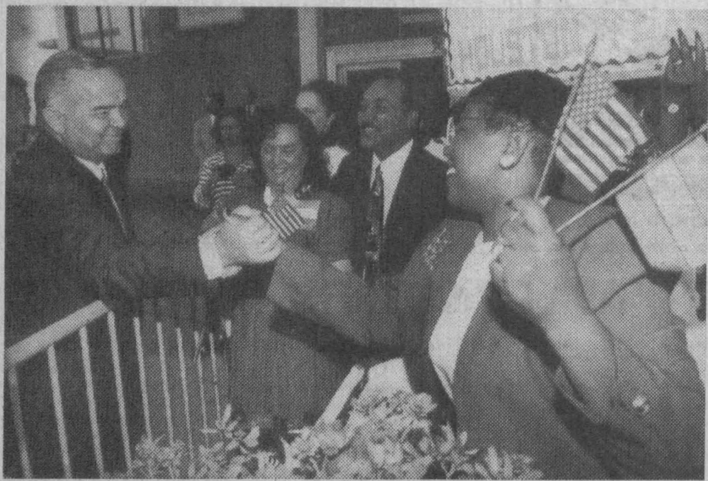
Америкаликлар Ислом Каримовни қутламоқдалар.