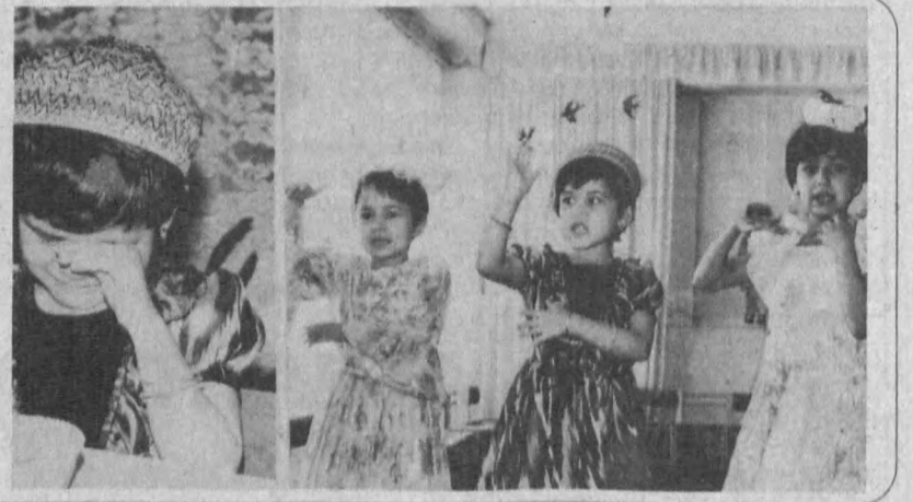
Болалик — умринг энг ширин, беғубор дамлари, дейишади. Дарҳақиқат шундай. Чунки дунё кўзингга фақат қўнғончалардан иборатдай қўнғонган, ҳамма-ҳамма нарса сенинг хизматингга гуё шай бўлиб турган оилар ҳар бир инсон ҳаётида бир марта бўлади. Ҳатто аримас нарса деб кўз ёш қилинган пайтлар ҳам кейинчалик ширин хотира билан эсланади. Шунинг учун «Болаликим — подшоҳим» деган нақд бежиз айтмаган.

«Оқшом» номи билан атадувчи ширинлик ҳеч кимнинг меъласига тегмайди. Чунки у хушхўрлиги билан ажралиб туради. Албатта тайёрлашга ҳаракат қилиб қўринг, сизга ҳам маъқул бўлади. Торт учун сарфланадиган масалиқлар: 200 грамм шаккар, 6 та тулум, 200 грамм ун. Тайёрлаш усули: 6 та тулум чақилиб, қўпирғунча аралаштирилади. Шу аралаштирилиши жараёнда ша-