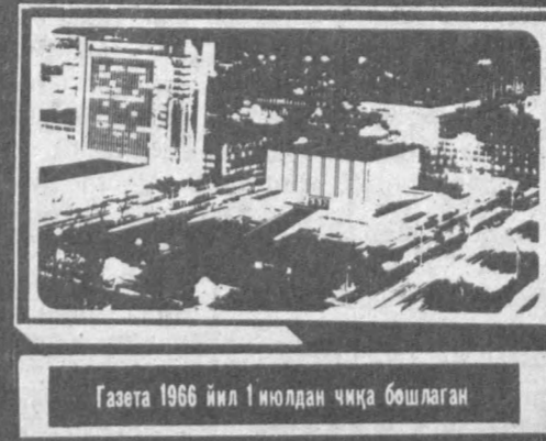
Газета 1966 йил 1 июлдан чиқа бошлаган