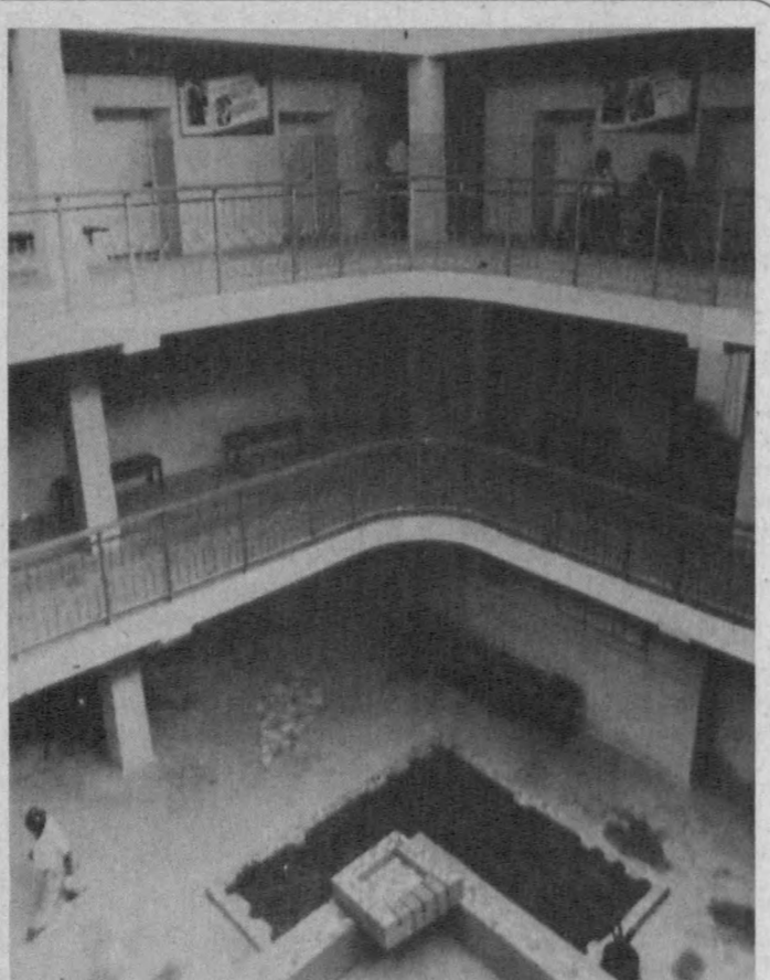
Туманда қурувчилар катта юмушларни бажармоқдалар. Айниқса Олимлар шаҳарчасида тикланган «Бахт уйи» шу маҳаллада яшовчиларга катта совға бўлди. Одамларнинг соғлиғини сақлаш борасида ҳам туманда катта эътибор берилади. Айниқса 13-шифохонанинг замонавий асбоб-ускуналар билан таъминланиши, шифохона ичининг дилаторлар қилиб таъмирдан чиққани диққатга сезовордир. СУРАТЛАРДА: «Бахт уйи»нинг ташиқ жамоаси; 13-шифохона-нинг ички қурилиши ана шундай. Шифохонанинг физиотерапия хонасида.