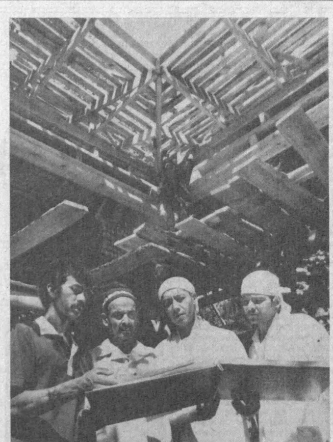
Ҳар қандай ишга режа билан киришялди. Айниқса, авлоддан-авлодга ўтиб келатган устачилик касбида қурилмажак уй лойиҳасини чуқур ўрганишиишг аҳамияти катта. Бунда ҳам устоз-ишгорди ананчалариса қатъий амал қилинади.