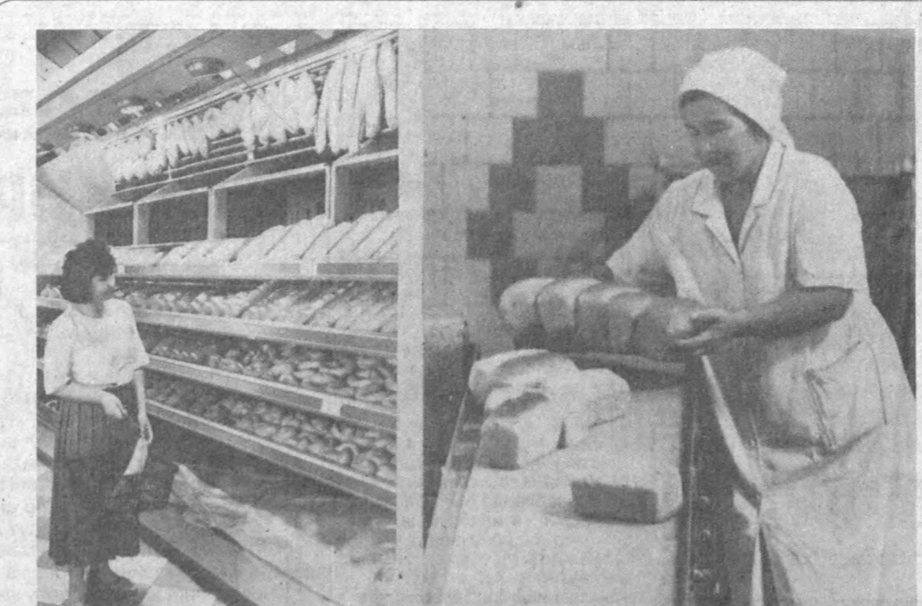
Дастурхонимиз кўрקי бўлган нон ҳамма замоналарда азиз саналган. Шунинг учун ҳам одамларни она шу нонмат билан таъминлаш савоб ишлар сирасига кириди. Бугунги кунда Мирзо Улуғбек туманидаги «Файёзи ва барқали» нон-квччи корхонаси жамоаси ана шундай эзу амалга қўя уришган. Бу ерда бир кунда 8 ярим тонна нон қайта ишланб 20-25 миң нон маҳсумотлари тайёрланади. Ушбу жамоа бугунги кунда ён-атрофдаги маҳаллар аҳолисини иссиқ нон билан таъминламоқда. ***