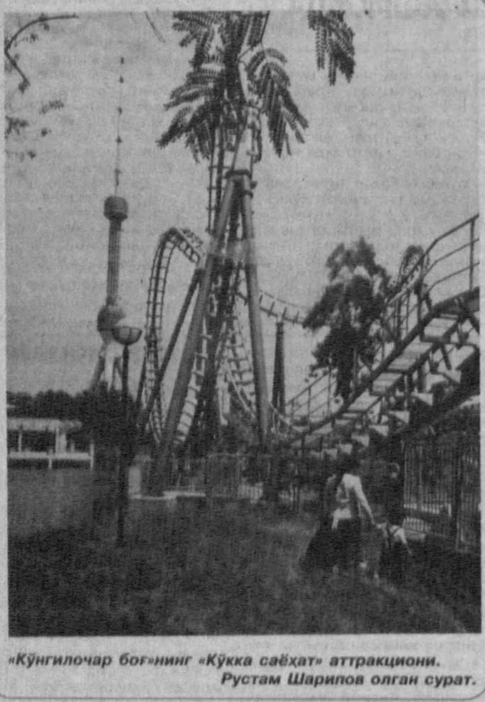
«Кўнғилочар боғ»нинг «Кўкка саёҳат» аттракциониди.