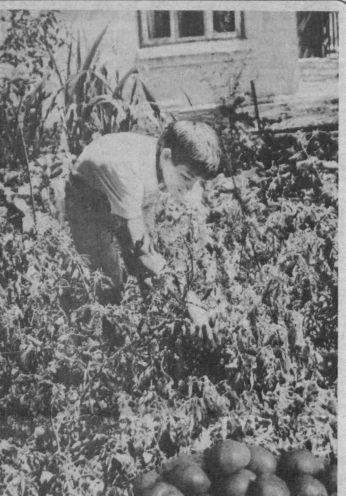
Помидор ҳосили мўл бўлди. Рашид Галиев олган сурат.

фар қўчаларни сугориб бўлгач, ерга қўйилган идишларни ҳам сувга тўлдириб, озини маҳкамлаб қўяман. Намлик идиш тағидида тешик орқали аста-секин илдизларга бориб етаверади. Сувнинг ана шундай захираси иккита одатдаги сугоришнинг ўрнини босади. Ерга меҳри баянда, экин-тикинсиз яшолмайдиган ҳам-шаҳарларимиз орасида ҳали ҳеч ким қўллаб қўрмаган тажрибаларга ўз таътирликларини, тадбиркорликларини билан амал қилаётганлар кўп албатта. Бундай тажрибаларни ушбу саҳифамиз орқали бошқаларга ҳам ёйилишини истаб, мактублар қўтиб қоламиз.