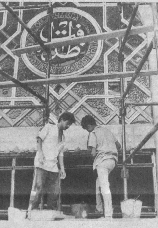
Бир эмас минг қарра офаринлар айтмоқ жоиз. Оппоқ устуларни, шиваванд шифтларни томоша қилганча қалбимда чироқ ёниб, ичкарига қадам қўйдим.

Учликка қараб чўқур ҳаёлга чўдим. Катта ўтов. Утов олдидан уч қиз. Утов тепасида эса хумо куши. Шу онда ҳаёлимга соҳибқироннинг юлдузлар силсиласи остида туғилгани марказий қисмида эса ўртада тахтда Амир Темур ўтирибди. Унинг атрофида олимлар, фозалолар, лашкарбосчилар, Ясавий макбараси Оксарой, яна бир қанча аҳойиб меъморий иншоотларнинг рамзи бу ерда ақланади. Учинчи «Мерос» қисми эса киши юрагига бирмунча изтироб солади. Соҳибқироннинг авлодларга қолдирган мероси муаллифлар томонидан ниҳоятда зўжколик билан ҳал этилган. Нуруний мўсафид ёш йигитга китоб ҳада этмоқда. Китоб йиллар бўйи тўпланган шон-шўхрат, йигит эса шу шон-шўхратнинг нуносиб вориси. Учала суратни бириштириб мовий сув оқиб ўтади. Сув — умр дегани. Соҳибқирон эса ўзининг умрини зое яшамади.