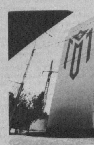
Келгусида бунёдкорлик ишларининг наватдаги боқичи бошланади. Очилган йўлларнинг икки томонида уч қаватли бинолар қурилади. Уларнинг биринчи қаватида

магазинлар, маъмурий идоралар, юқори қаватларида эса яшаш учун мўлжалланган кватиралар жойлашади.