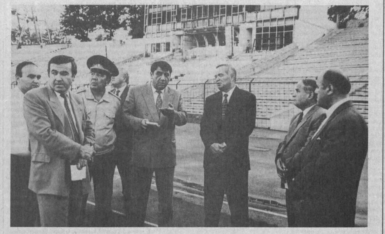
Суратда: спорт иншоотларини кўриш пайти.