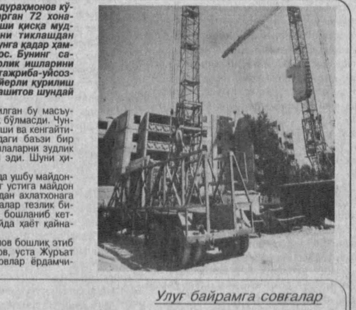
Улуг байрамга совғалар