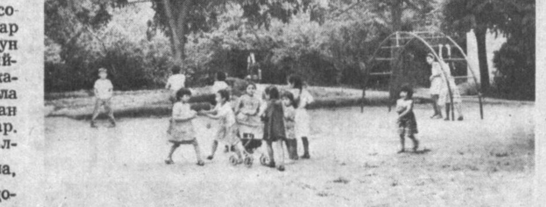
Ушбу уйда кўп қасатли уйларида таҳсинга лойиқ.

яшамондалар. Даҳанинг асо-сини кўп қасатли бинолар ташкил қилганлиги учун тўй-маршалар, маданий машғул тадбирларни ўтга-зиш мақсадида маҳалла аҳолиси ҳашир йўли билан маданий марказ қурдилар. Унда 150 кишига мулк-ланган тўйхона, чойхона, маҳалла комитетининг идо-