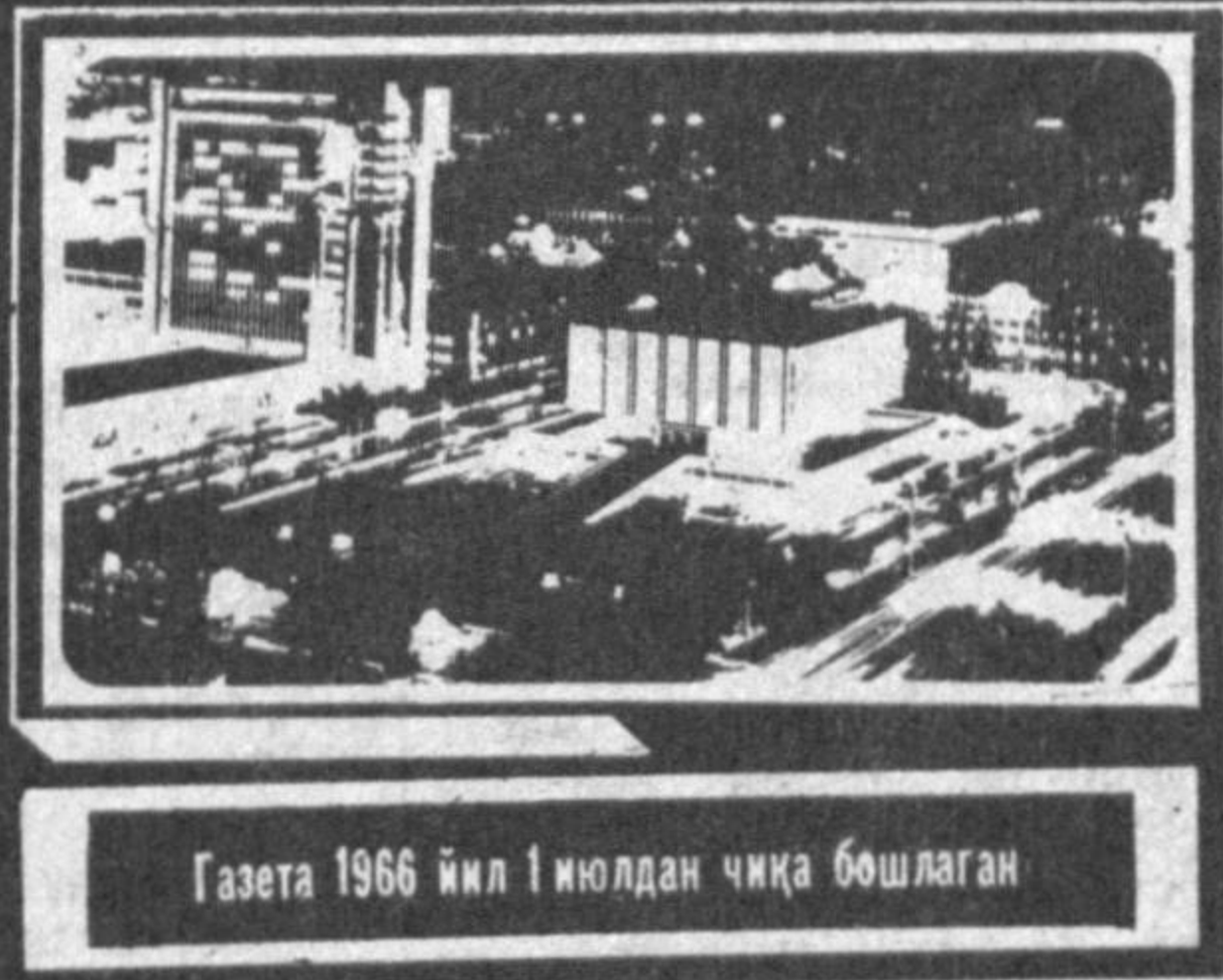
Газета 1966 йил 1 июндан чиқа бошлаган