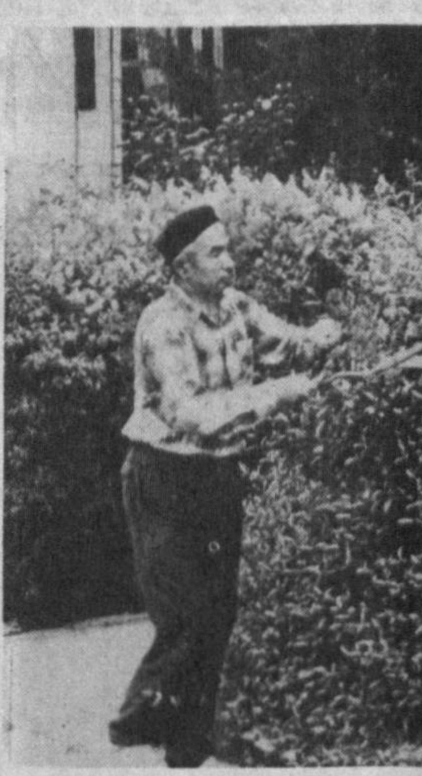
Ушбу уйда кўп қасатли уйларида таҳсинга лойиқ.

МИРОВОД туманидаги Кўлдиқ 1/3 даҳаси бундан ўн йил аввалги давр билан тақдирланса, бутунги кунга келиб унинг қиёфаси табиб бўлмас даражада ўзгариб кетганлигини гувоҳи бўлиш мумкин.