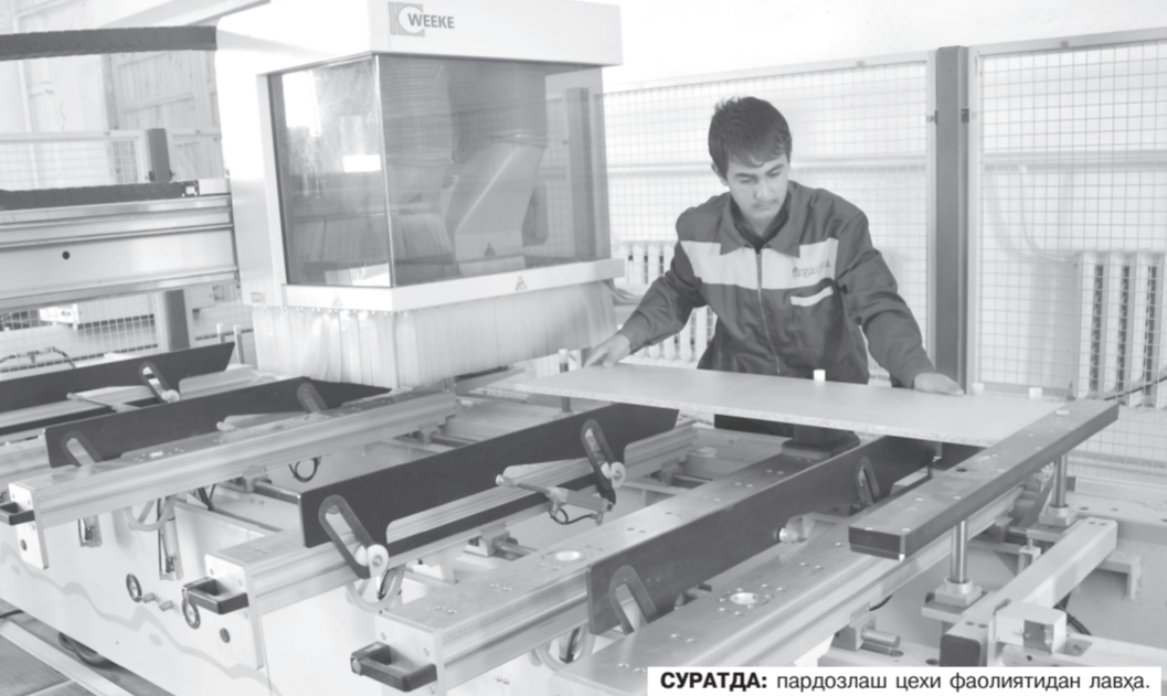
СУРАТДА: пақдозлаш чеҳи фаолиятдан лавҳа.