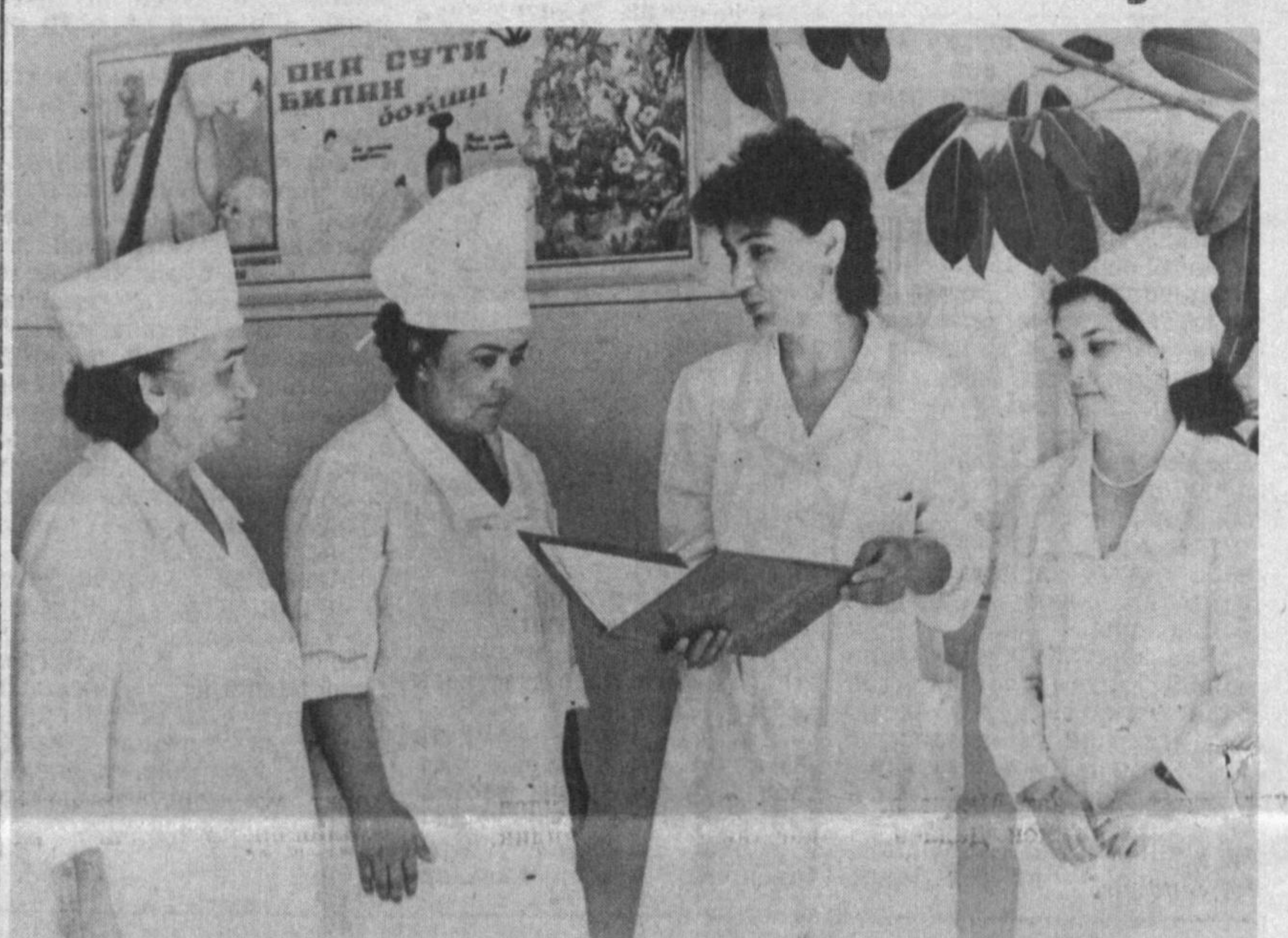
«УЗҚИШЛОҚМАШ» ишлаб чиқариш бирлашмаси қошидаги тиббий-санитария қисми бўлган кунда корхонанинг 2 мияг ишчи-хизматчисидан ташқари яна атрофдаги 30 минг кишилик аҳолига ҳам намуналар тиббий хизмат кўрсатиб келмоқда. Ҳозирда бу ерда терапия, ички касалликлар, юрак ва асаб касалликлари бўлимлирий феоли ишлаб турибди. Мазкур тиббий муассаса «н-атрофда» жойлашган 2505 ва 2515-автокорхоналар, вакцина ва зарарли илмий-тадқиқот институти, «Узқшомарказ», иккита ўрта махсус билим юрти каби 8 та корхона ва ташкилотларда ўзининг тиббий-шохобчаларига ҳам эга.

Тиббий-санитария қисми «Узқшлоқ-маш» корхонаси ишчиларига намуналар хизмат кўрсатиш билан бирга уларни ҳар йили тиббий кўриқдан ўтказиб боради, ишчиларнинг иш шaroити билан мунтазам равишда бохабар бўлиб туради. Олинган хулосалар юзасидан корхона маъмуриятига ишчилар соломатлиги муҳофазаси йўлида тақлиф ва тавсиялар беради. Корхона ҳам ўз навбатида тиббий муассасани зарур бўлган жиҳозлар, дори-дармонлар билан таъминлашда ёрдамчи ямаётир.